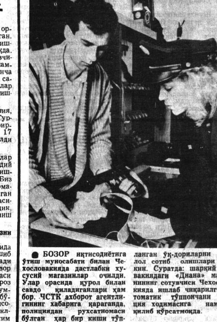
БОЗОР иқтисодиётига қўйилган эътиборнинг натижасида...