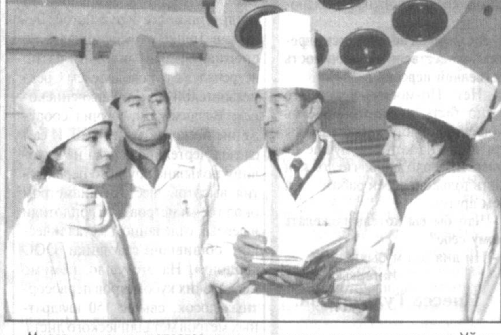
Много внимания уделяется улучшению услуг здравоохранения в Уйинском районе. Здесь вступила в строй новая станция «скорой помощи». Теперь врачи по любому вызову могут приехать в самый дальний кишлак за считанные минуты и оказать квалифицированную помощь.