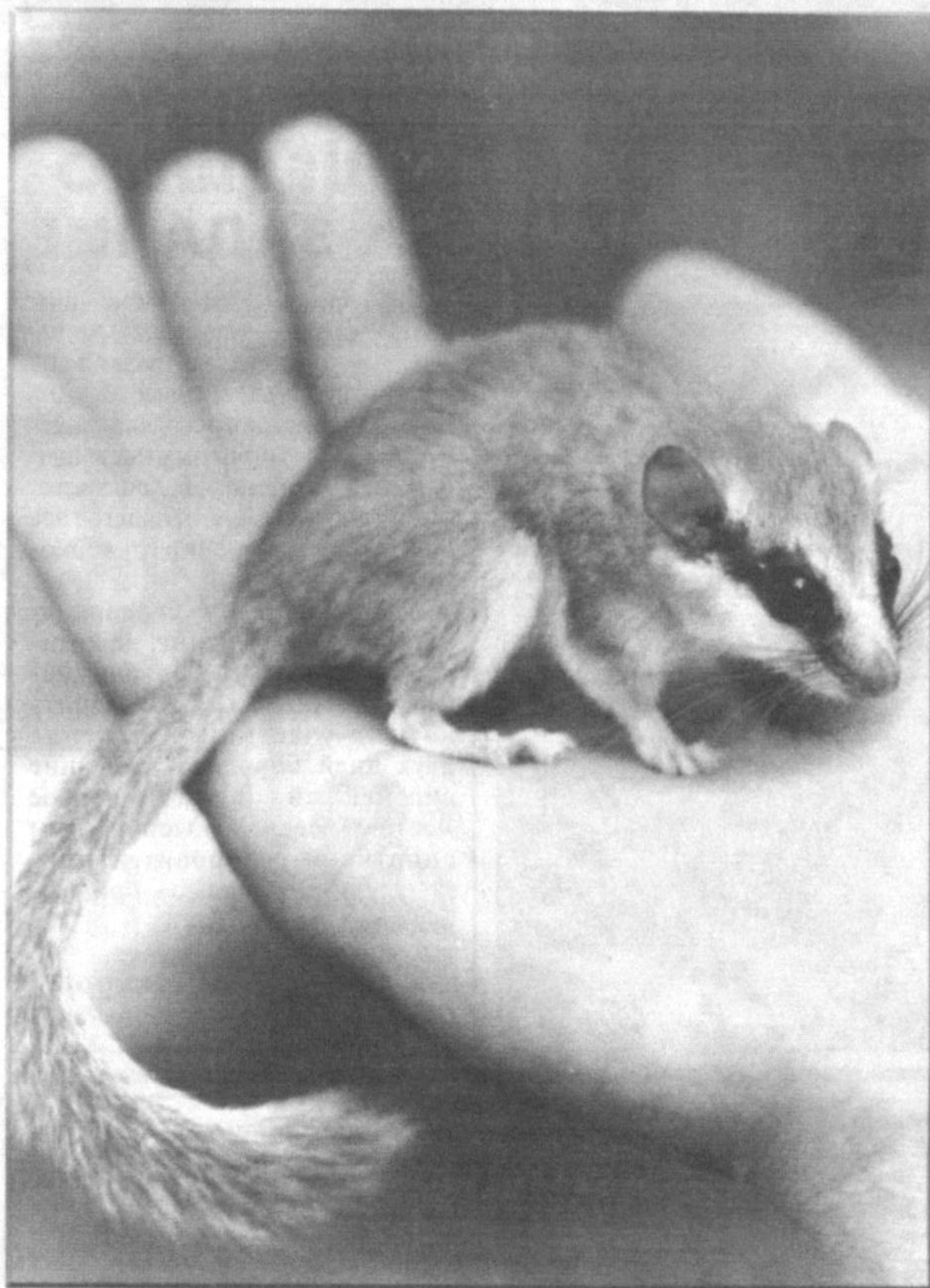
Ласка на ласковой ладони.