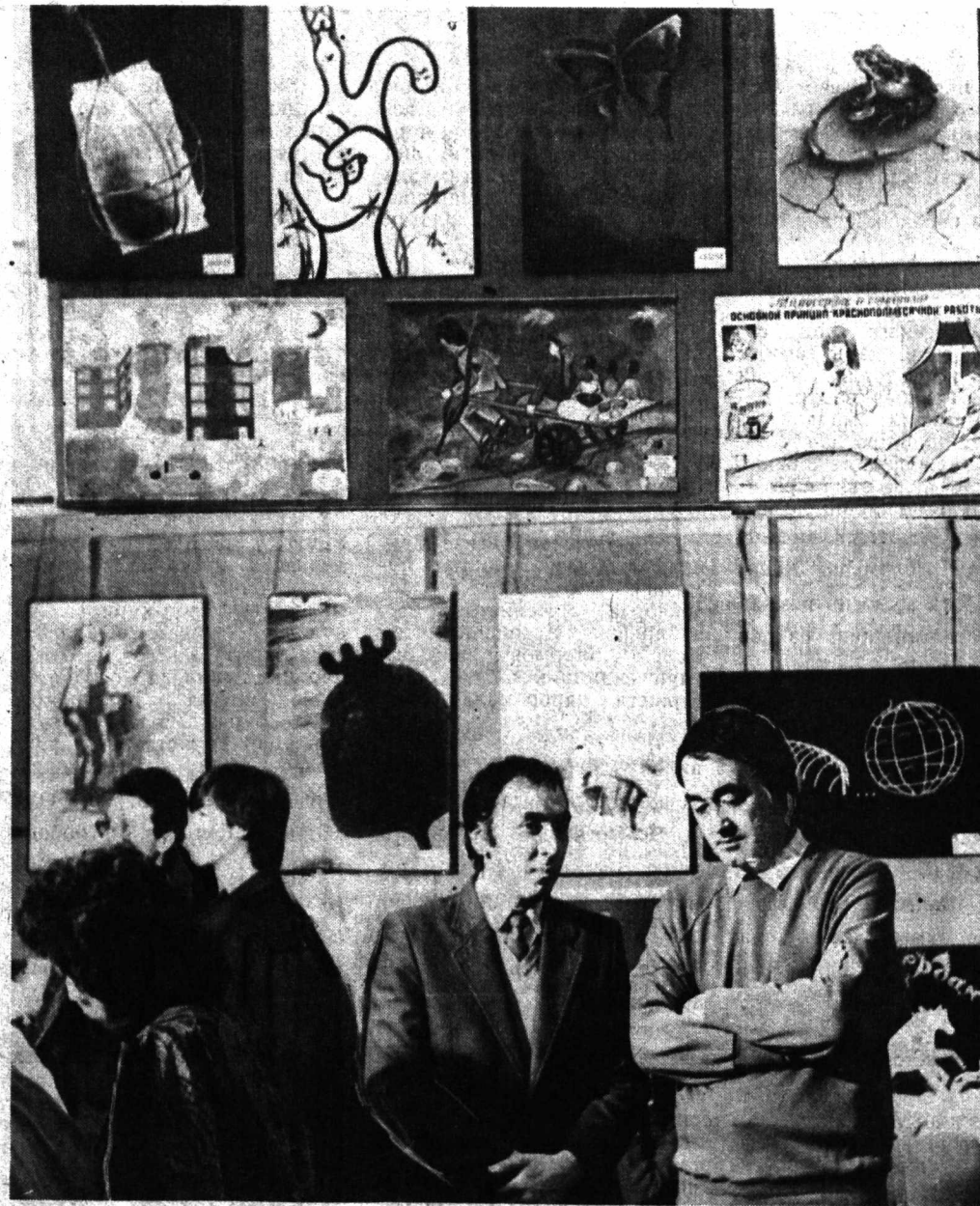
ТОШКЕНТДАГИ театр-рассомчилик олий илми...