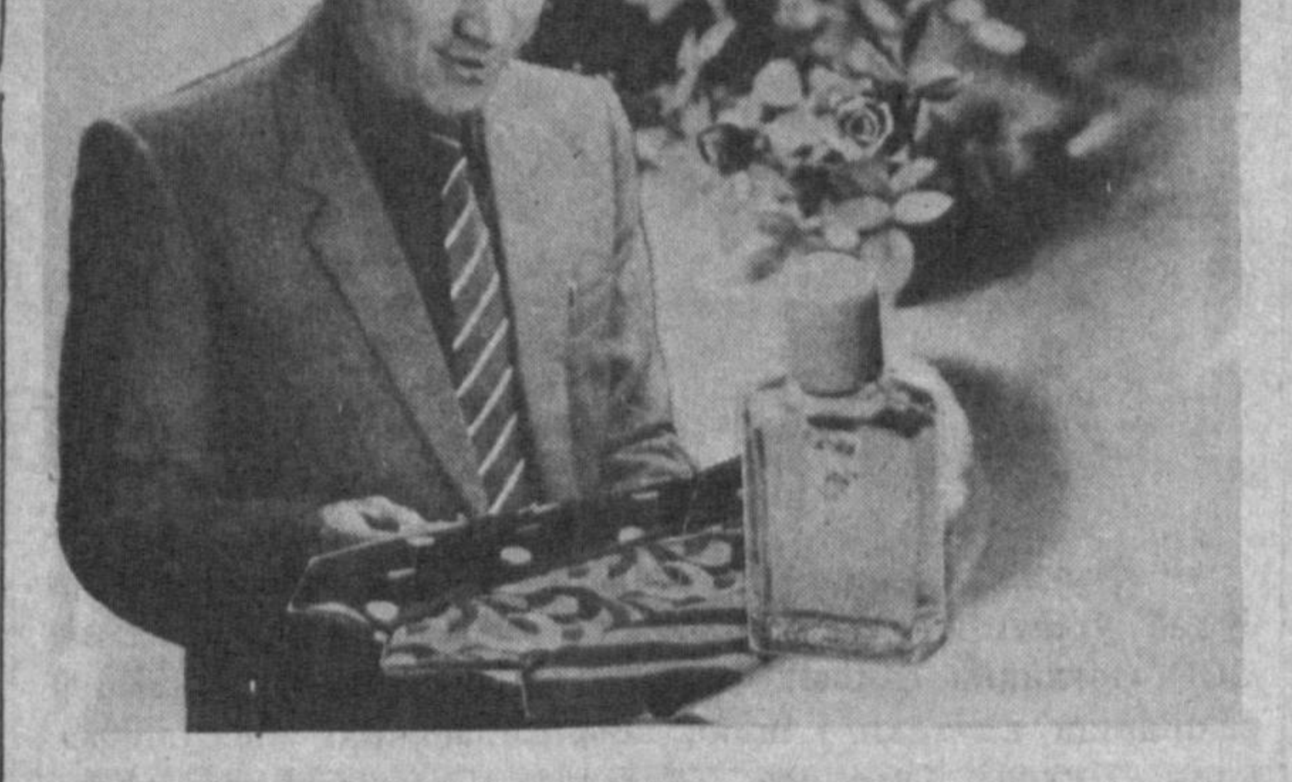
«СОЮЗРЕКЛАМА» БУТУНИТИФОҚ ИШЛАБ ЧИҚАРИШ БИРЛАШМАСИНИНГ ЎЗБЕКИСТОН РЕКЛАМА ИШЛАБ ЧИҚАРИШ ҚОРҲОНАСИ.

«Токивичлик фабрикасида таёрланган эркаклар кўйлақларига бир назар ташланг!» Улардаги бичим, бекалар ва ранглар турли-туманлигидан кўнгириқ қамашади.