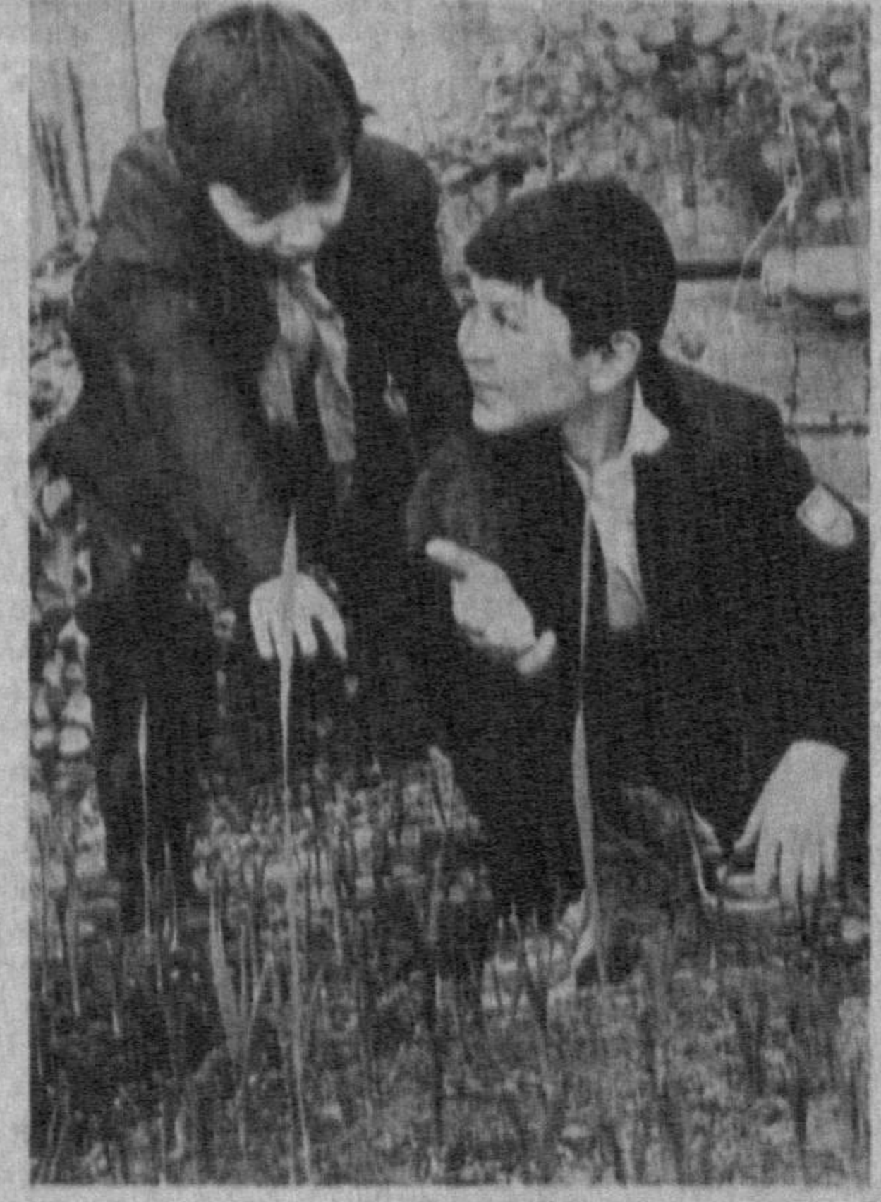
«Биз анкан долалар Наврўзда очилди, дўстим».