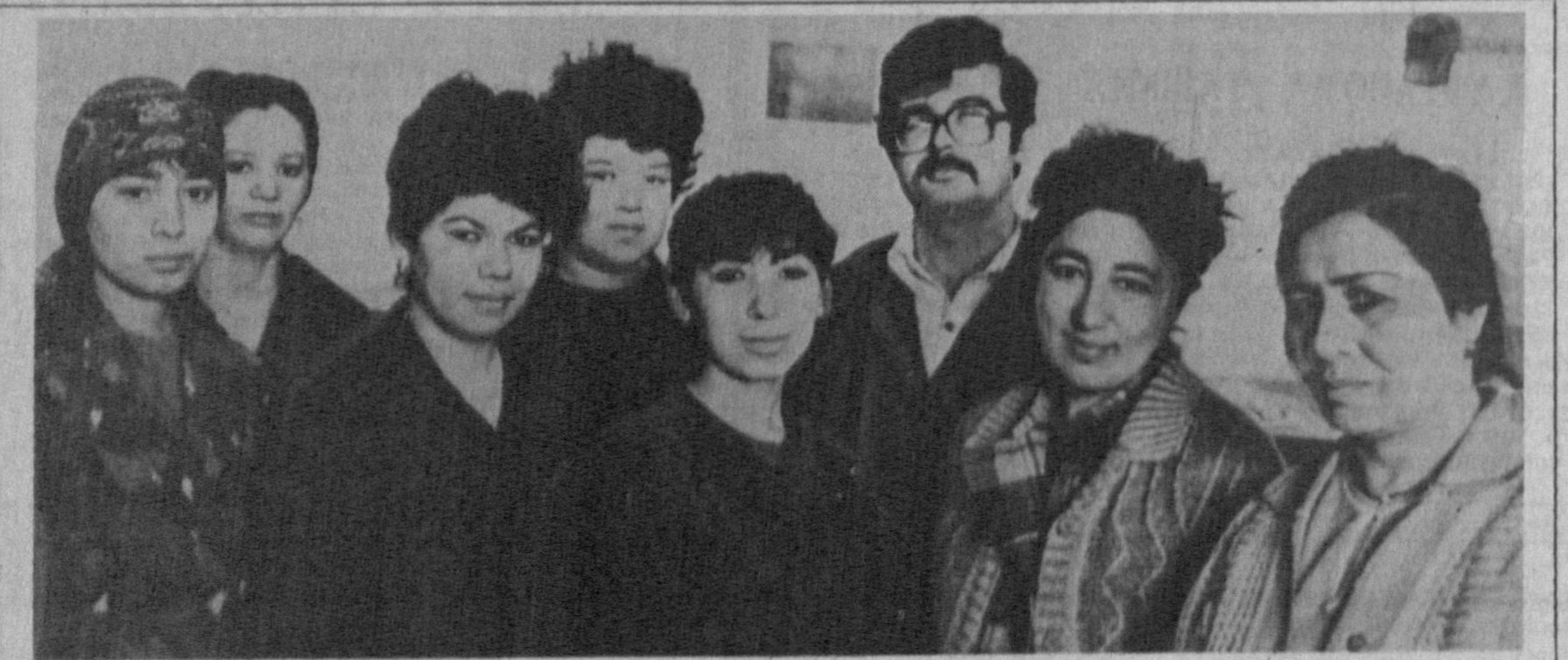
Тошкент механика тажриба ускунаозлиги ва техника мосламалари заводи. СУРАТДА: ойна чеккининг бир гуруҳ илгорлари. Х. Солиқов сурати.