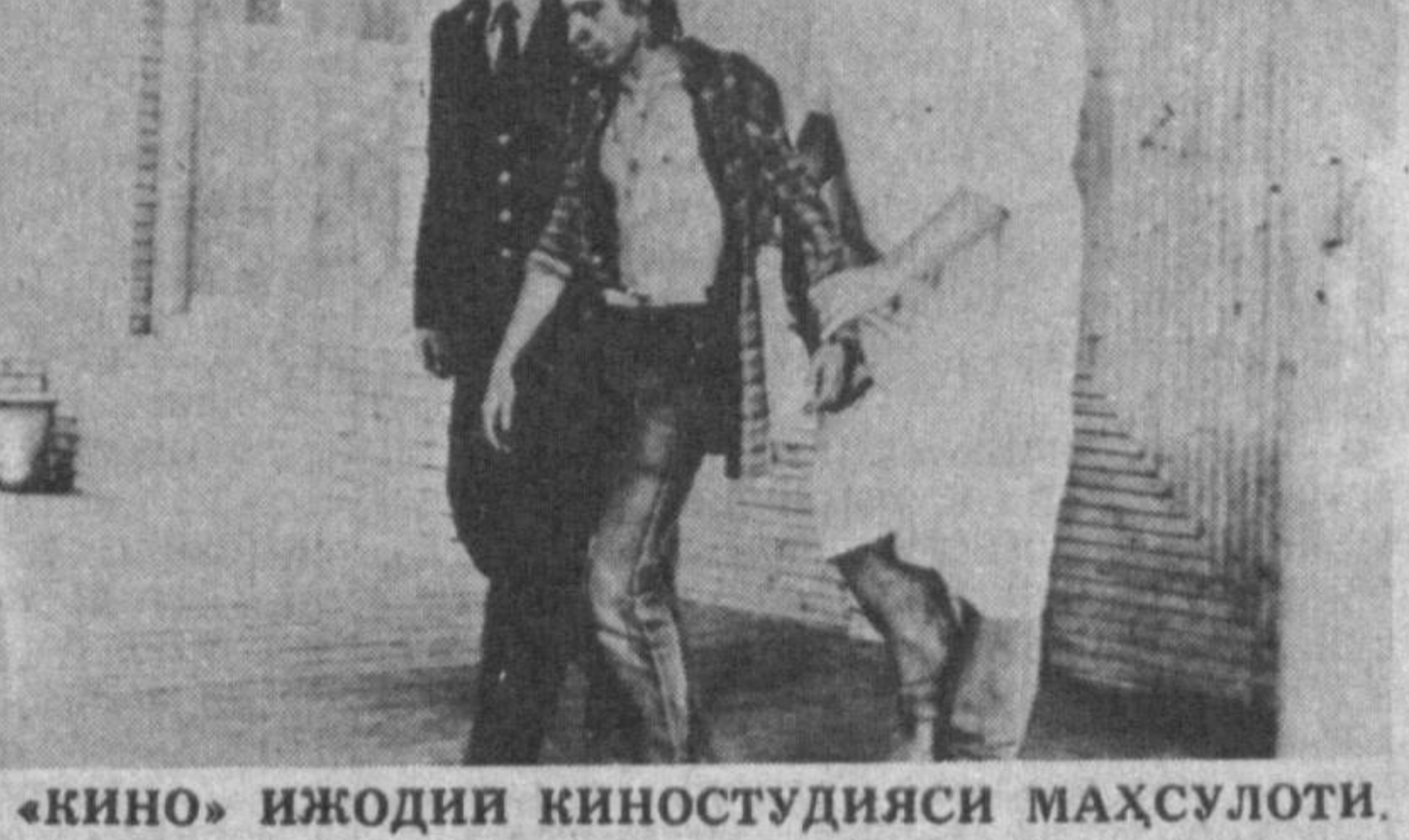
«КИНО» ИЖОДИИ КИНОСТУДИЯСИ МАХСУЛОТИ.

Жангарликкача бориб етувчи фаолиятлари билан улар куллари борица ўз мустақилликларини ҳимоя қиладилар.