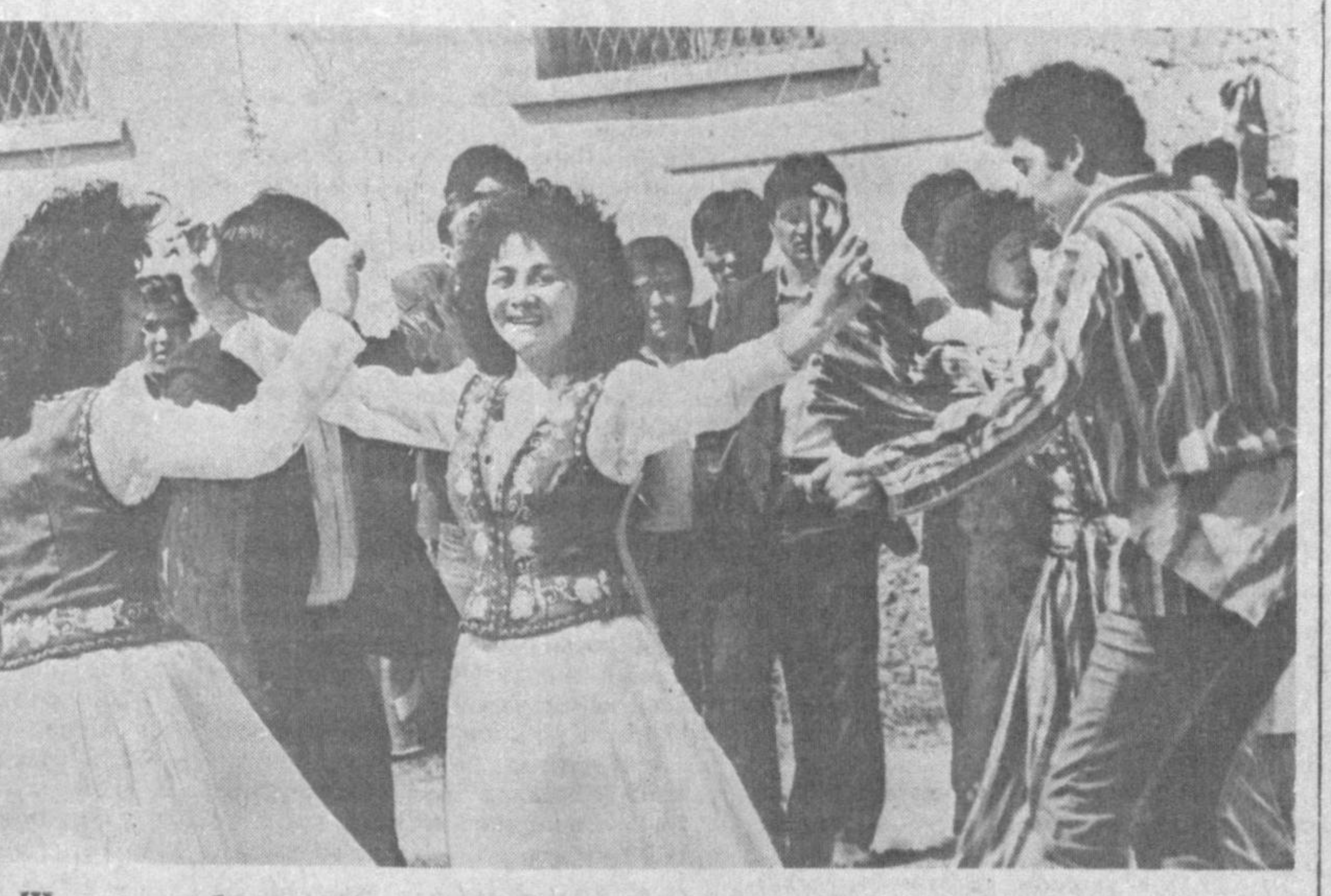
Шодлик ва бахт элчиси Наврўзи ўтган шодиёналаридан лавҳалар. оламнинг ўтган йили Тошкентда бўлиб

Киров райони меҳнат аҳли ўтган йили Наврўз байраминда қаровсиз қолган қариялар, кам таъминланган oilалар ва болалар уйларида хабар олдидилар. Уларга гуруҳ, ёр, чой ва ун каби озиқ-овиқат маҳсулотларини таратишти. Хар маҳаллага ўрта ҳисобда 500 сўмдан 1200 сўмгача ёрдам пули қўрсатилди. Ночорларга чанг-юттич, шолча, совуттич каби нарсалар берилди. Бу йил ҳам яна шундай хайри иншлар учун камарбаста бўлган Киров райони Кенгаши икромчи бундай саъоли ҳаракатларнинг бошида турибди. А. ҲИДОЯТОВ.