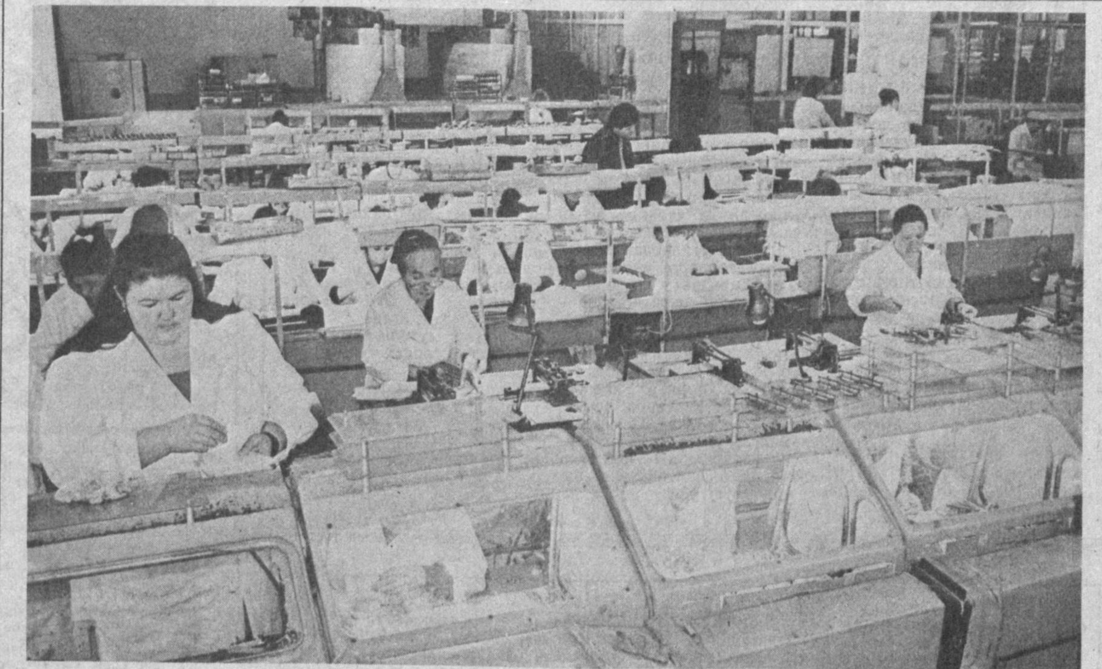
«Миконд» заводи цехларидан бирида тайёрланаётган конденсаторлар тиббиёт курсларида, видеомагнитофонлар, ҳисоблаш техникаларида кенг қўлланилмоқда. Мана бир йилдирки, бу жамоа ижарага ўтиб ишлапти. Ишлаб чиқаришни тўғри ташкил этиш, меҳнат ҳақини тақсимлаш, истеъмолчилар билан тўғридан-тўғри алоқани йўлга қўйиш ва бошқарувдаги мустиқлик технологияси жараёнларнинг бир маромада бажарилишига имконият яратди. СУРАТДА: конденсаторларни йиғиш цехида.