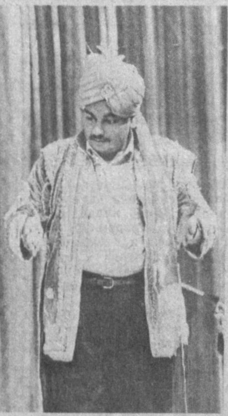
СССР Халқлари дўстлиги саройида Хиндистоннинг «Бомбей арт группа» эстрада дастаси, «Индиян Маджик группа» хинд сеҳргарлик гуруҳи ҳамда «Ўзбеконцерт» қошидаги «Ханда» жумҳурият ижодий маркази ўз чирқиларини кўрсатди. Бир неча кун давомида Ўзбекистон