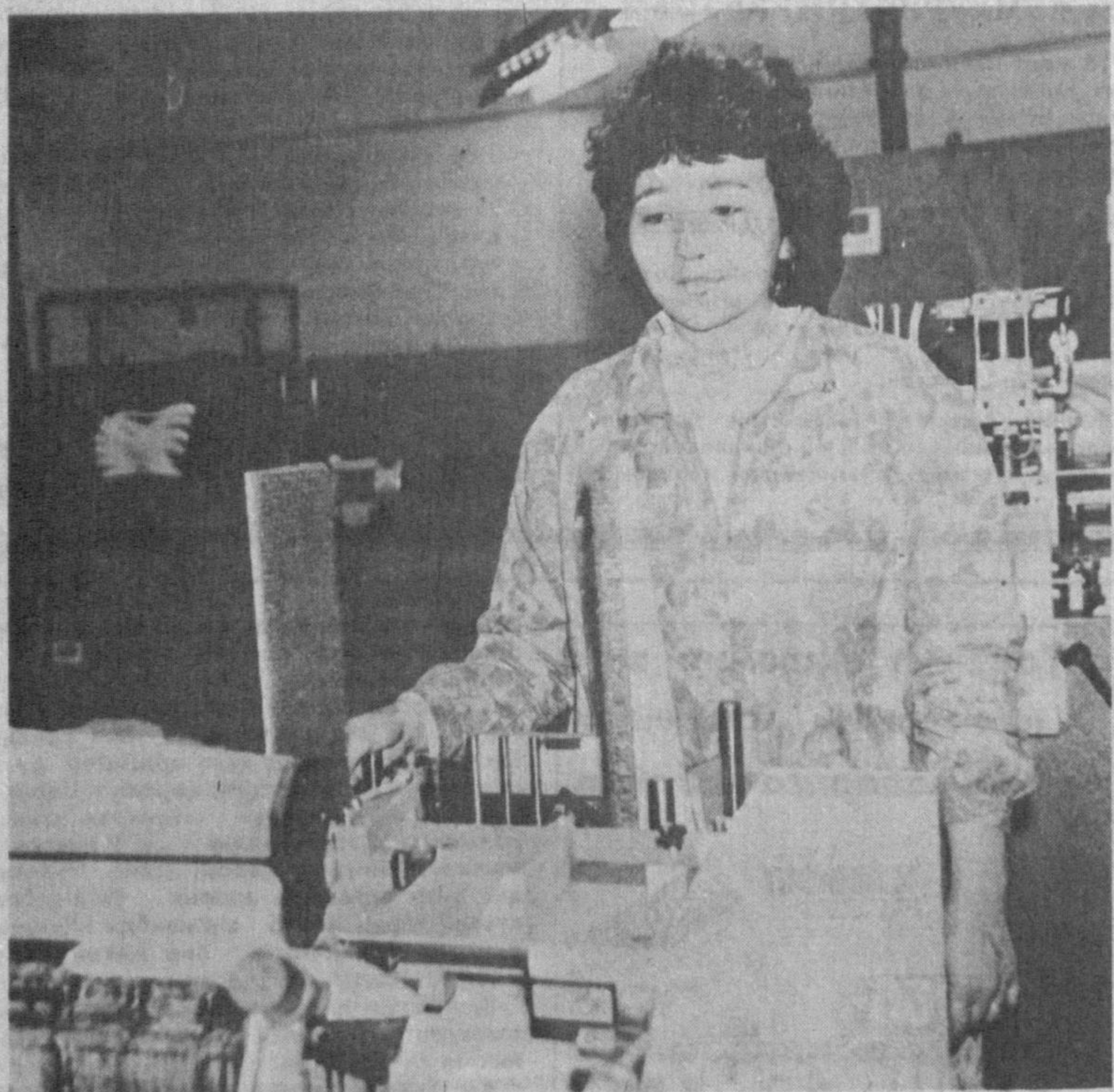
2-пайабал ишлаб чиқариш бирлашмаси махсулотларига бўлган талабнинг тобора ошиб бораётганини сиринида? Бирлашмада бўлган лойтишда ана шу саволинига жавоб топдик. Ундан муштарийларимизни ҳам хабардор қилмоқчимиз.