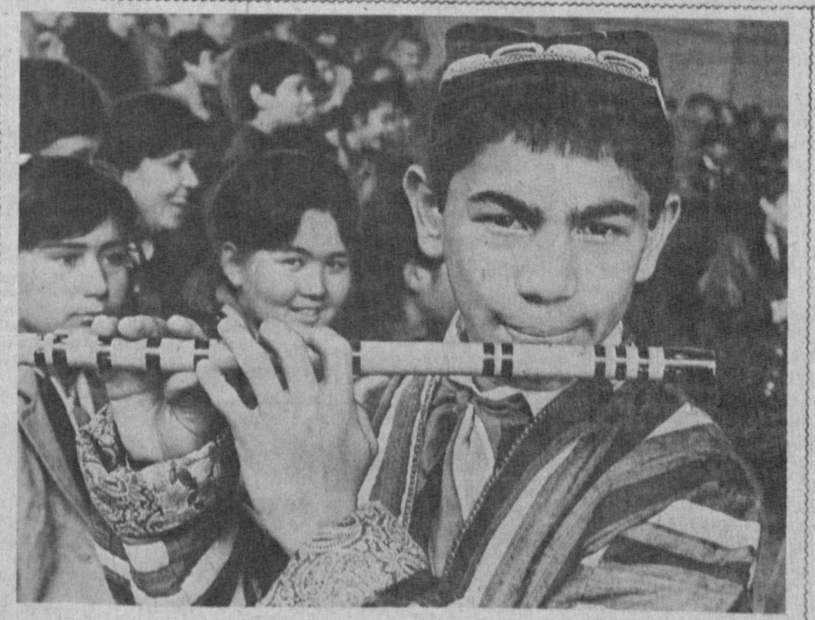
«НАНИНГ СИРЛИ НАВОСИ»