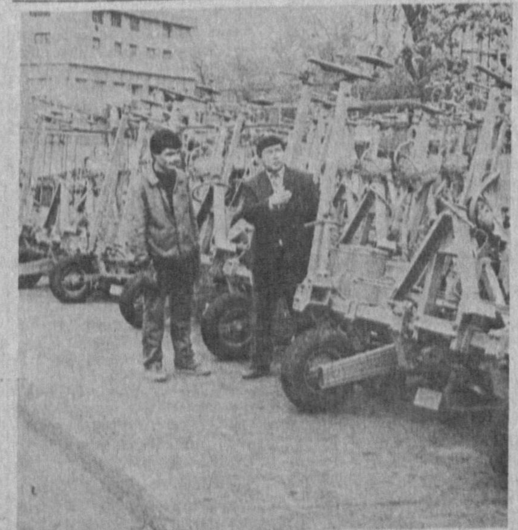
«Ўзбексельмаш» ишлаб чиқариш бирлашмаси машина соҳалари бу йил қишлоқ хўжалиги эҳтиёжлари учун 3 мингта универсал «СХМ-4» маркада экинч носдалмаларини тайёрлашди. СУРАТДА: қишлоқ аҳлига жўнатилмаётган селкалар.