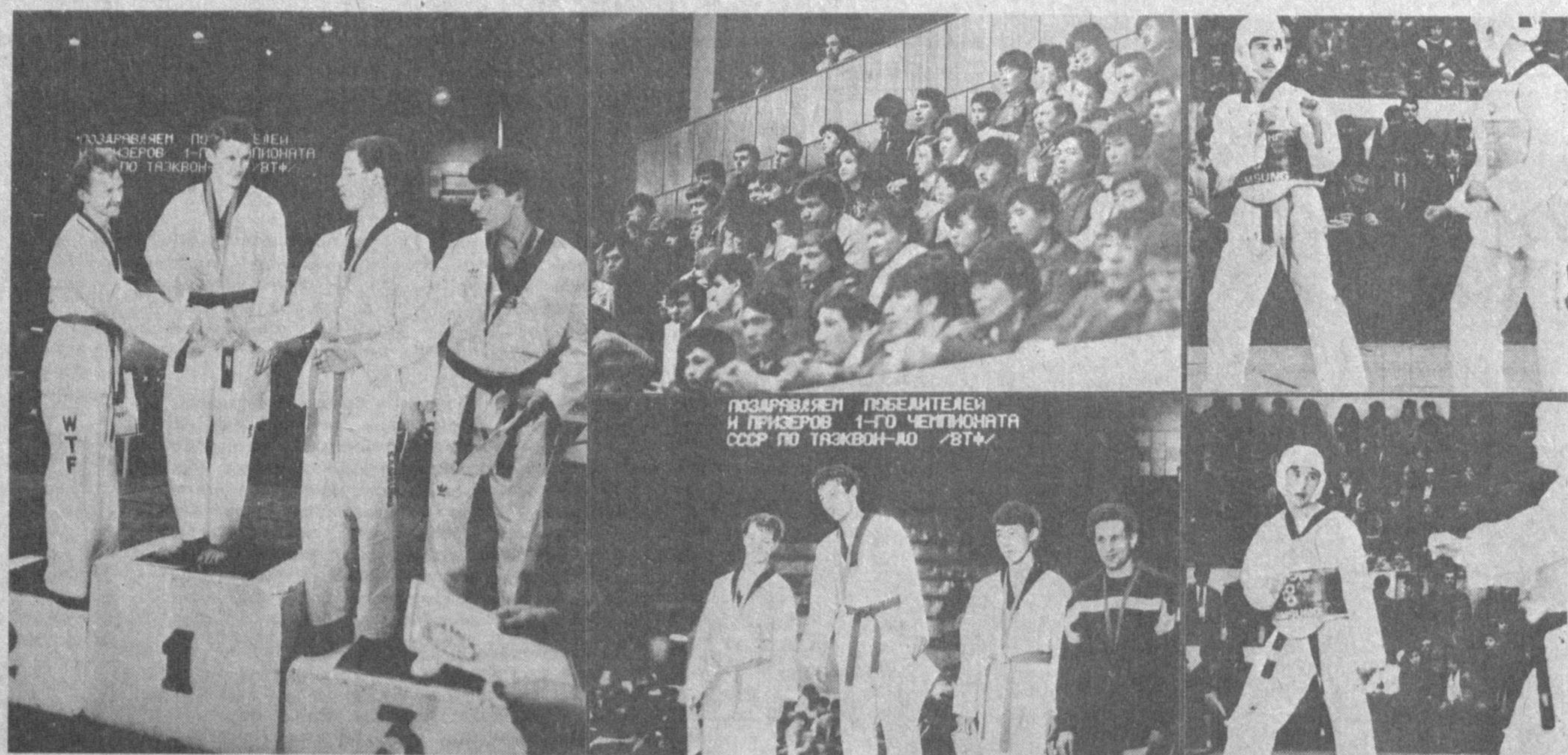
ПОЗНАВАЯЕН ПОБЕДИТЕЛЕМ И ПРИЗЕРОВ 1-ГО ЧЕМПИОНАТА СССР ПО ТАЗКВОН-ДО