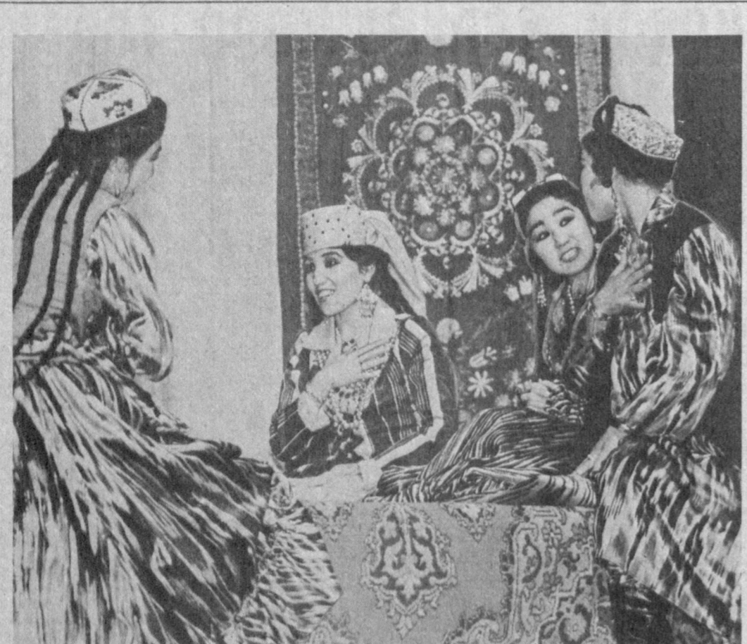
ТАШКЕНТ. Новый фольклорно-этнографический ансамбль «Эр-Эр» создан при КИЦ «Искусство». Новый ансамбль призван знакомить зарубежных гостей нашей республики с обычаями, традициями, ритуалами узбекского народа. В коллективе 25 человек. Это выпускники Ташкентской государственной консерватории, Государственного театрально-художественного института, хореографического училища. Многие из них — лауреаты республиканских и всесоюзных конкурсов. Первая программа нового ансамбля — музыкально-танцевальная композиция узбекского свадебного обряда «Эр-Эр». Подрядные новости. НА СНИМКЕ: эпизод из свадебной композиции «Эр-Эр».