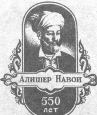
АЛИШЕР НАВОИ 550 лет