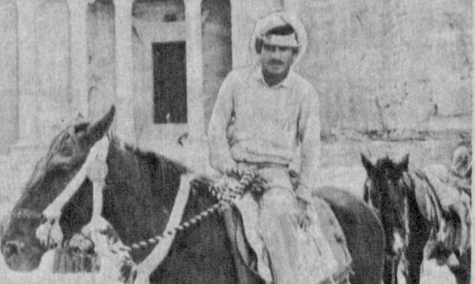
ИОРДАНИЯ. В 250 километрах к югу от Амман лежит Петра — древняя столица Иорданского государства, существовавшего на территории нынешней Иордании свыше двух тысяч лет назад. Это уникальный город, насчитывающий свыше тысячи различных архитектурных сооружений — храмов, дворцов, жилых домов, театров, рынков, усыпальниц, вырубленных в отвесных скалах. Иорданское царство в свое время было крупным государством, границы которого простирались далеко на север и восток. Его столица — Петра являлась важным торговым центром Ближнего Востока. Сюда приходили нараваны верблюдов, доставлявшие из Южной Аравии и с берегов Персидского залива ткани, слоновую кость, благовония и пряности, драгоценные камни и другие товары, поступающие из Индии и Восточной Африки. Изменения торговых путей, римские завоевания привели и гибели Иорданского государства и упадку Петра, которая до XIX века оставалась забытой и упущенной. Петра сегодня (на снимке) — одна из главных исторических достопримечательностей страны, пользуется большой популярностью у многочисленных туристов, привозящих в страну полуболезни уникальным уголок древней культуры.

беспорядков пострадало 197 объектов, в том числе 40 жилых домов. Сумма ущерба — 10 миллионов рублей. По известным фактам убийства военнослужащих и массовых беспорядков в Наманганской области 14 уголовных дел в отношении 15 лиц направлены в суд. Шесть уголовных дел в отношении семи человек уже рассмотрены Наманганским областным судом. Все подсудимые признаны виновными и приговорены к различным наказаниям. Материалы в отношении 24 человек направлены в комиссию по делам несовершеннолетних, 48 человек понесли административные наказания. Следствие по остальным уголовным делам продолжается. Более подробно о причинах и обстоятельствах событий в Андижанской и Наманганской областях мы рассчитываем рассказать на шим читателям в ближайшем времени. А. АЛЕКСАНДРОВ.