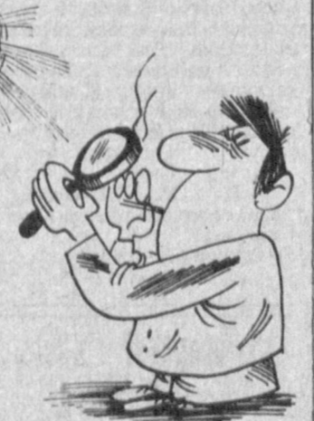
Рис. А. СОСЕДОВА и Ш. СУБХОНОВА.