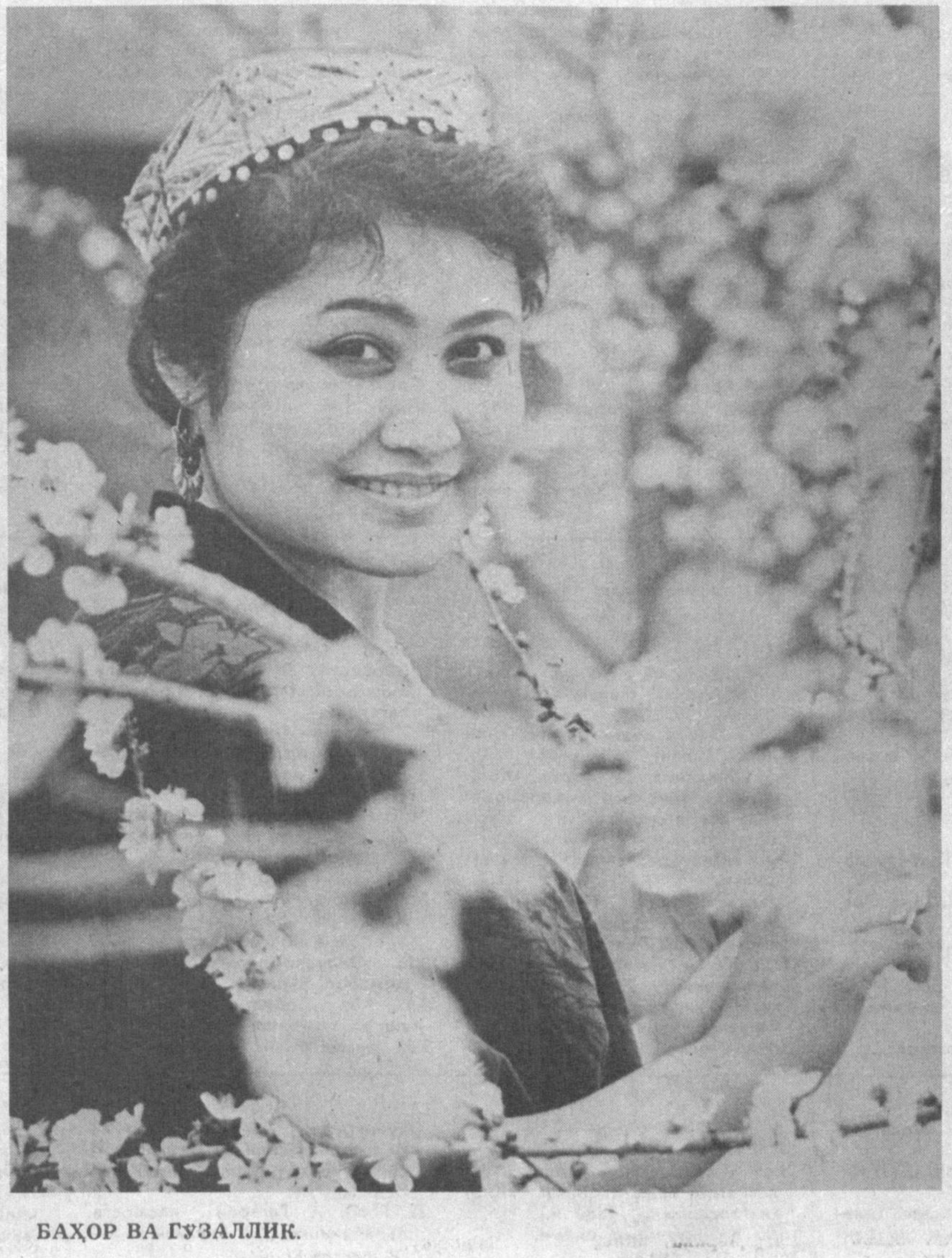
БАҲОР ВА ГЎЗАЛЛИК.

санитария ёрдами кўрсатиш ни ташкил этди. Бундан ташқари Бирлашган Миллатлар Ташкилоти тиббий офат асоратларини камайтириш бўйича халқроқ ўн йилликни бошлаган бир вақтда тиббий офатдан зарар кўрган жабрдий-деларга ўз вақтида ёрдам кўрсатиш учун Бутунжаҳон соғлиқни сақлаш ташкилоти ўз ҳаракатларини ҳар қачонгидан ҳам муштакамлашини истади. Шариф ИСЛОМОВ.