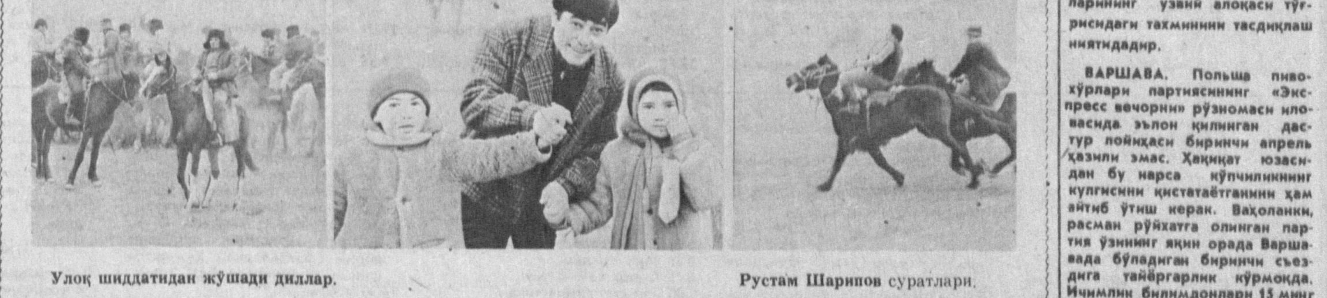
Улоқ шиддатидан жўшади диллар.