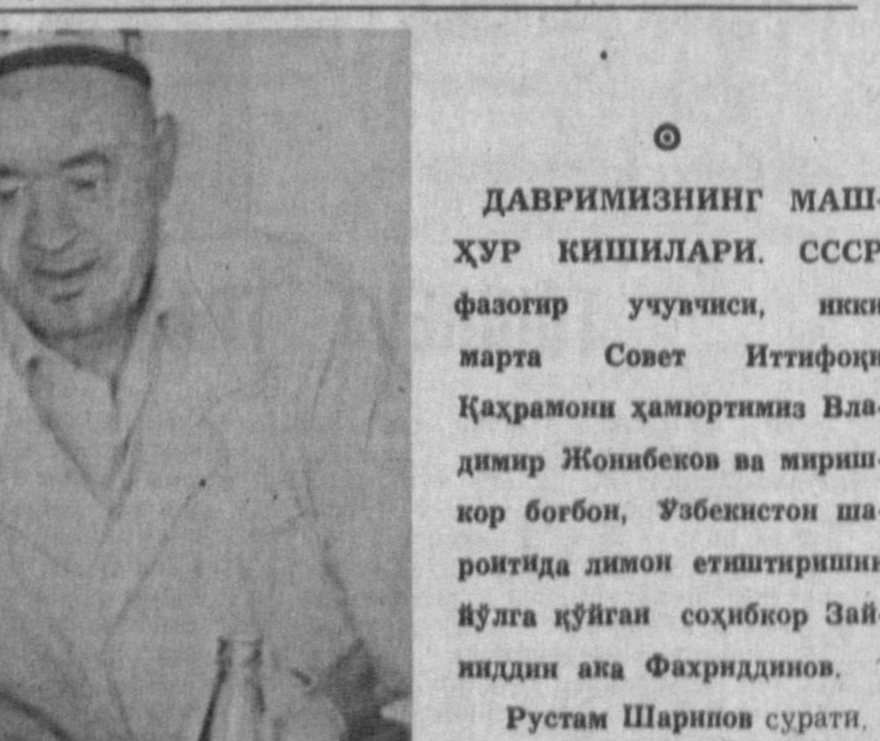
ДАВРИМИЗНИНГ МАШ-ХУР КИШИЛАРИ. СССР фазогир учувчиси, иккинчи марта Совет Иттифоқи Қаҳрамони ҳамюртиниз Владимир Жонбеков ва яришкор борбон, Ўзбекистон шароитида димон етиштиришни йўлга қўйган соҳибкор Зайниддин ака Фахриддинов.