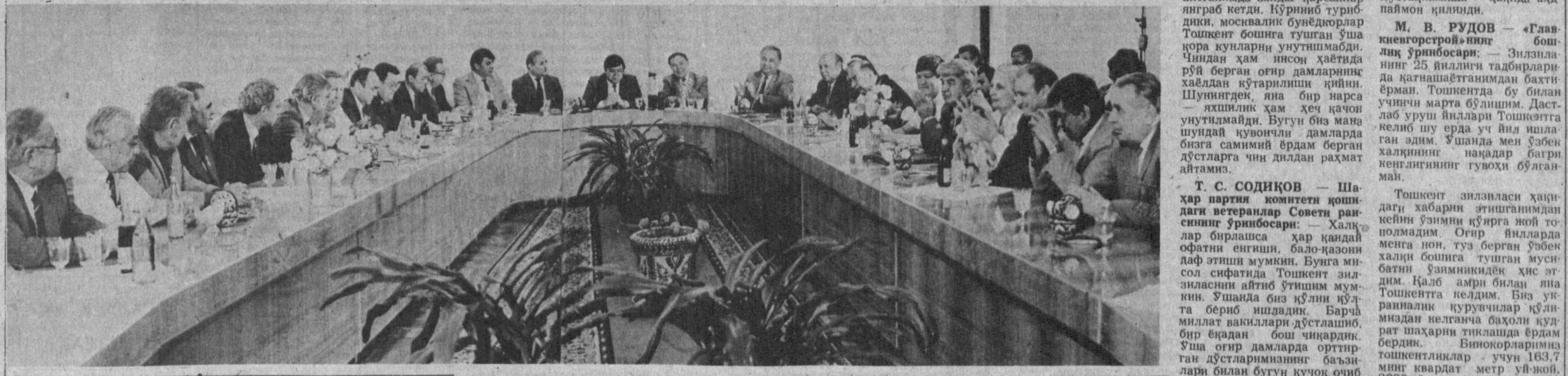
«Тошкент оқшони» ва «Вечерний Тошкент» рўзномалари Тошкент зилзиласининг 25 йиллигига бағишланган тадбирларда қатнашиб учун тақлиф этилган меҳмонлар билан давра суҳбати ўтказди.