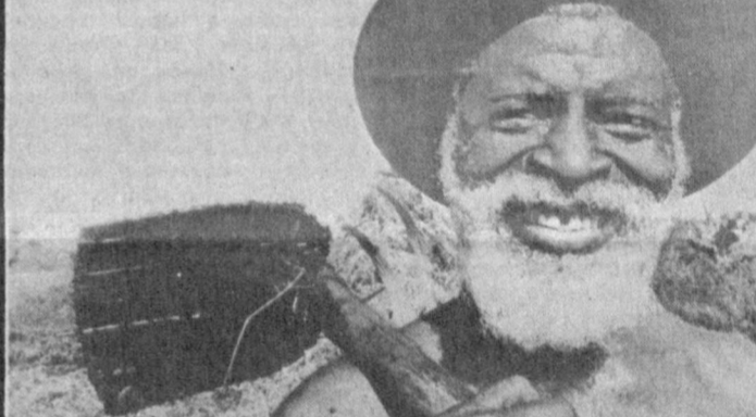
МОЗАМБИК. Старый крестьянин из Чове в провинции Газа.