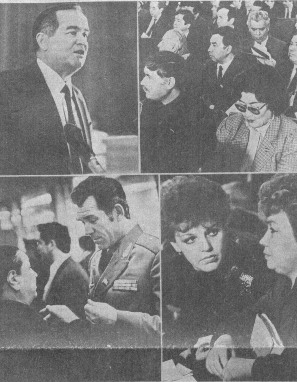
В зале заседаний сессии.

Председатель Верховного Совета Узбекской ССР М. ИБРАГИМОВ, гор. Ташкент, 14 февраля 1991 года.