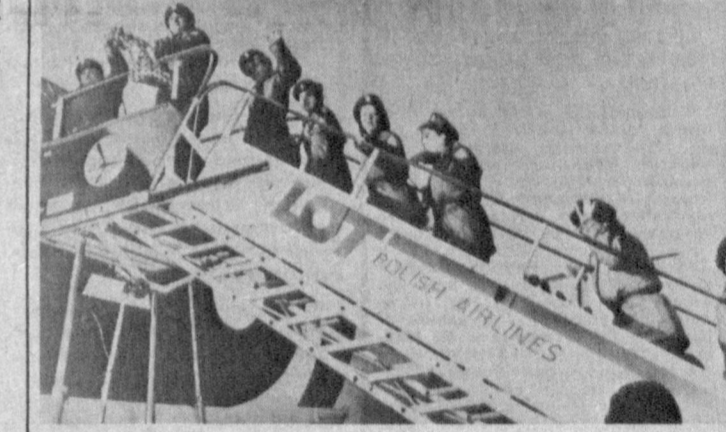
▲ ПОЛЬША. В район Персидского залива для работы в военных госпиталях вылетели 80 польских дежушек — медицинских работников.

▲ НЬЮ-ЙОРК. ПОДАВЛЯЮЩЕ БОЛЬШИНСТВО АМЕРИКАНЦЕВ ПОДДЕРЖИВАЕТ ПРОДОЛЖЕНИЕ ВОЗДУшной ВОЙНЫ В РАЙОНЕ ПЕРСИДСКОГО ЗАЛИВА В ПРОТИВОВЕС НАДАЧУ ВОЕВЫХ ДЕЙСТВИЙ НА СУШЕ. В ходе очередного опроса общественного мнения, проведенного агентством «Нью-Йорк», за продолжение операций в воздухе высказались 87 процентов участников исследования. Лишь 8 процентов сочли предпочтительным наступление сухопутных сил. Опрос показал, что индийский вторичный рынок США выступает против длительного американского военного присутствия в районе Персидского залива.