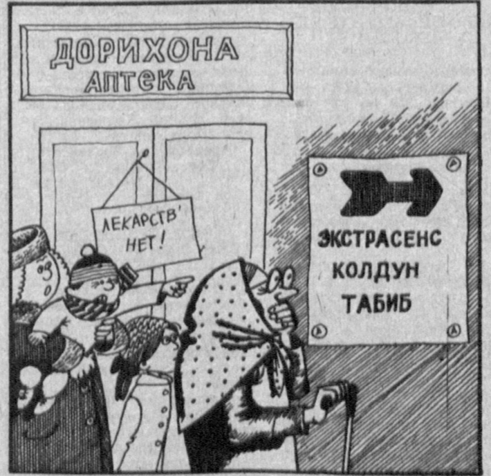
Рис. А. СУХАРЕВА.

Пресс-обозрение «Статистика: взгляд на общество».