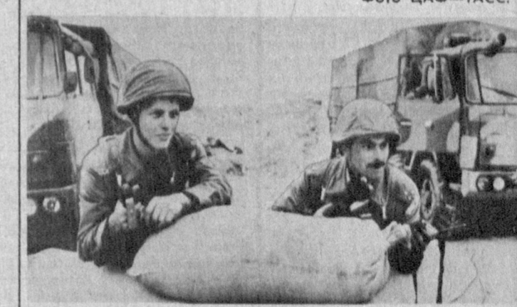
▲ ЧСФР. Чехословакия направила в район Персидского залива специальное подразделение противохимической защиты. НА СНИМКЕ: военнослужащие Чехословакии в Саудовской Аравии.

В связи с недавним заявлением совета революционного командования Ирана о готовности Багдада вывести свои войска из Кувейта премьер-министр указал на необходимость убедиться в истинных намерениях Ирана. (ТАСС).