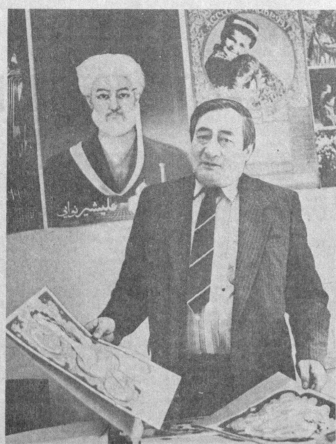
Издательство «Узбекистан» к юбилею Навои выпустило календарь. Автор — главный художник издательства Нури Алиев.