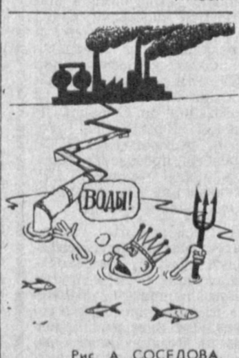
Рис. А. СОСЕДОВА.

По состоянию на 24 февраля совместное патрулирование работников милиции и военнослужащих Вооруженных Сил СССР при обеспечении правопорядка осуществляется в 484 республиканских, краевых, областных центрах и других крупных населенных пунктах Российской Федерации, Украины, Белоруссии, Узбекистана, Азербайджана, Казахстана, Киргизии, Таджикистана, Туркмении. Об этом сообщает пресс-центр МВД СССР.