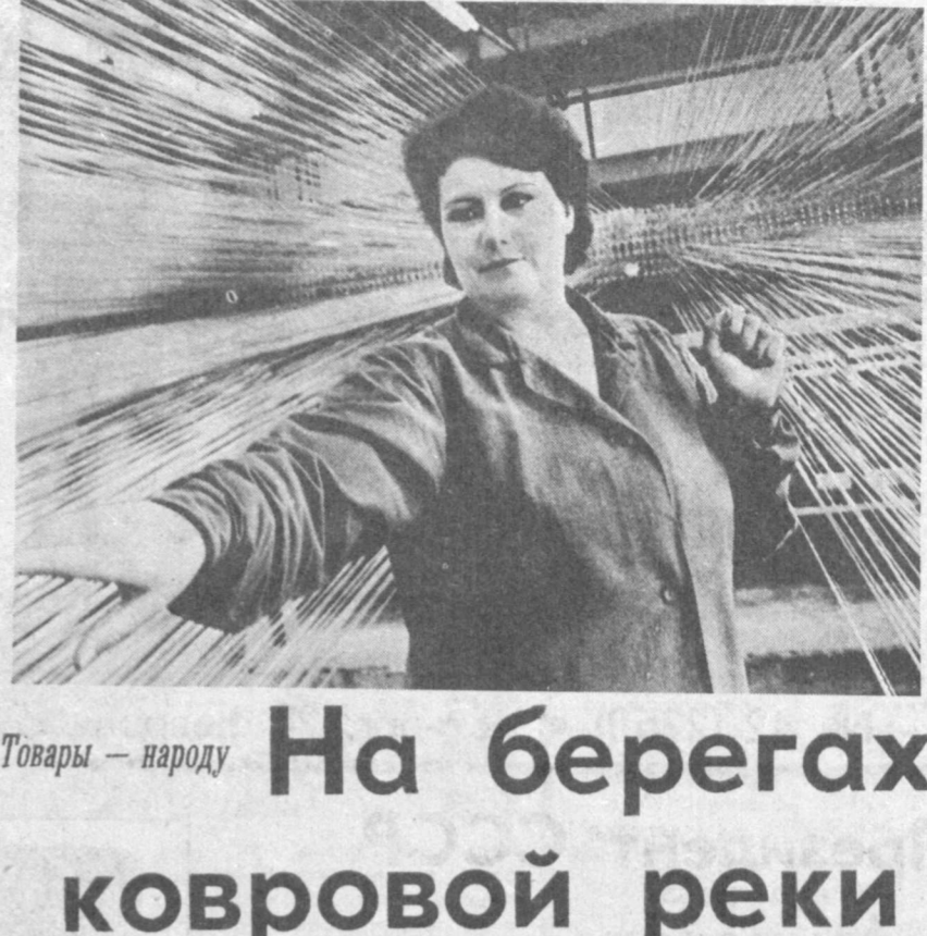
Товары — народу На берегах ковровой реки