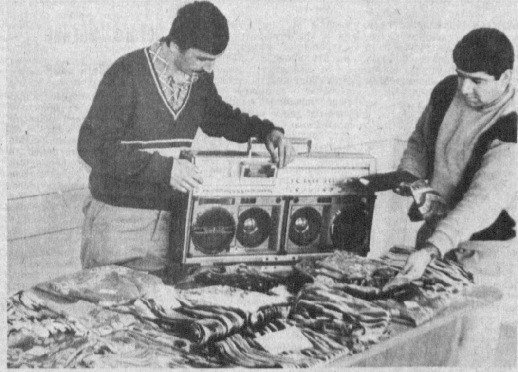
Успехом завершилась одна из операций сотрудников Наршнского ГОВД. Им ликвидирована воронская группа, последние несколько месяцев терроризировавшая город. На счету преступников несколько десятков ивартирных краж, другие преступления. У задержанных изъяты похищенные у граждан деньги.

И. НОВИКОВ, А. ПЕРШИН. Парламентские корреспонденты ТАСС.