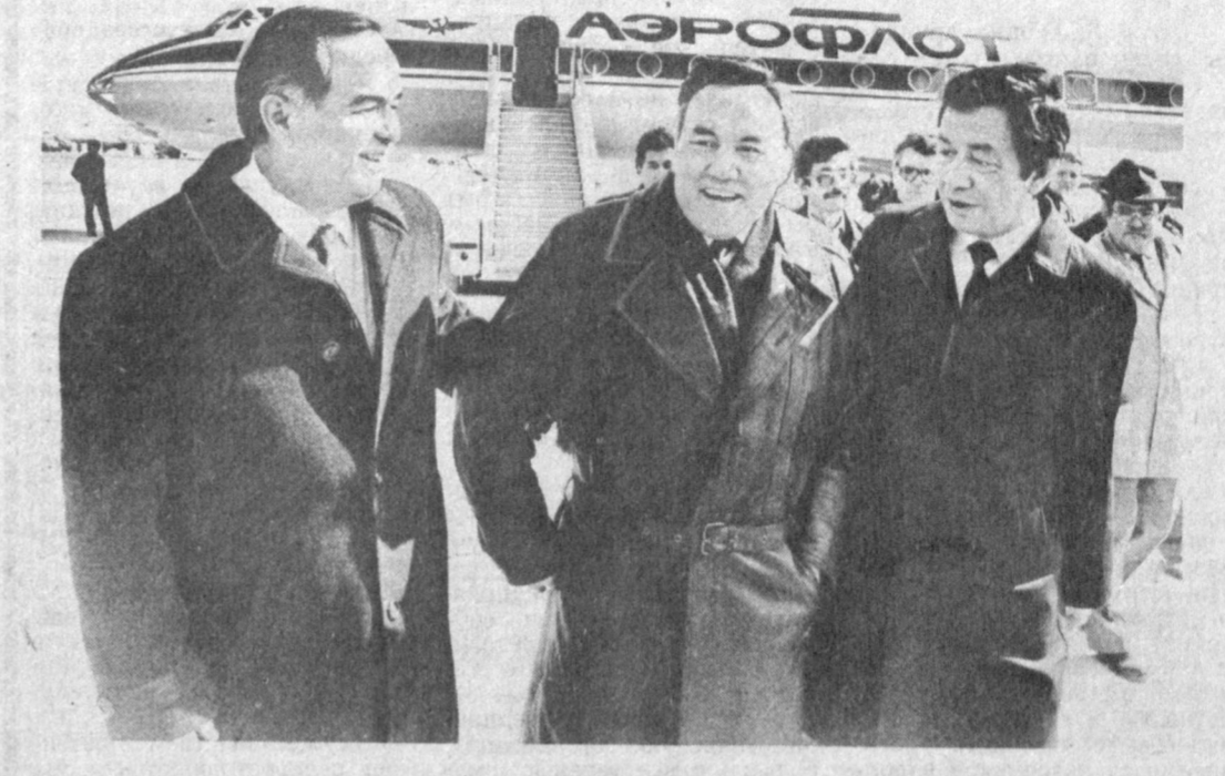
Во время встречи в аэропорту.

Есть и будут общие задачи и дела. Так, недавно я встречался с Президентом Кыргызстана Акаевым, ожидаем приезда руководства Туркмении. Хотим подвести итог некоторых результатов нашей прошлой встречи в столице Казахстана, а заодно договоримся, где состоится очередной раунд переговоров глав пяти республик.