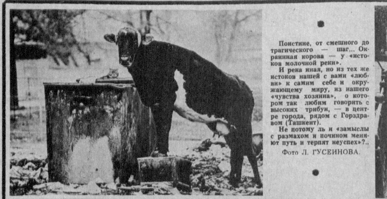
Понтиче, от смешного до трагического — шаг... Окрашенная козья — у истоков молочной реки. И река היא, но из тех же истоков нашей с вами «любви» к самим себе и окружающему миру, из нашего «чувства хозяина», о котором так любим говорить с высокими трибуны, — в центре города, рядом с Горьким (Ташкент).

● В Фергане концентрации формальдегида повысились с 2,7 до 3,3 ПДК. Содержание пыли составило 1,3, двуокиси серы — 0,4, окиси углерода — 0,7, двуокиси азота — 2,2, окиси азота — 0,8, сероводорода — 0,4, фенола — 1, хлора — 0,3, аммиака — 0,8 ПДК.