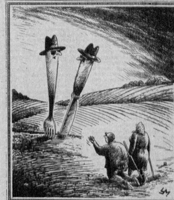
Рис. А. УМЯРОВА