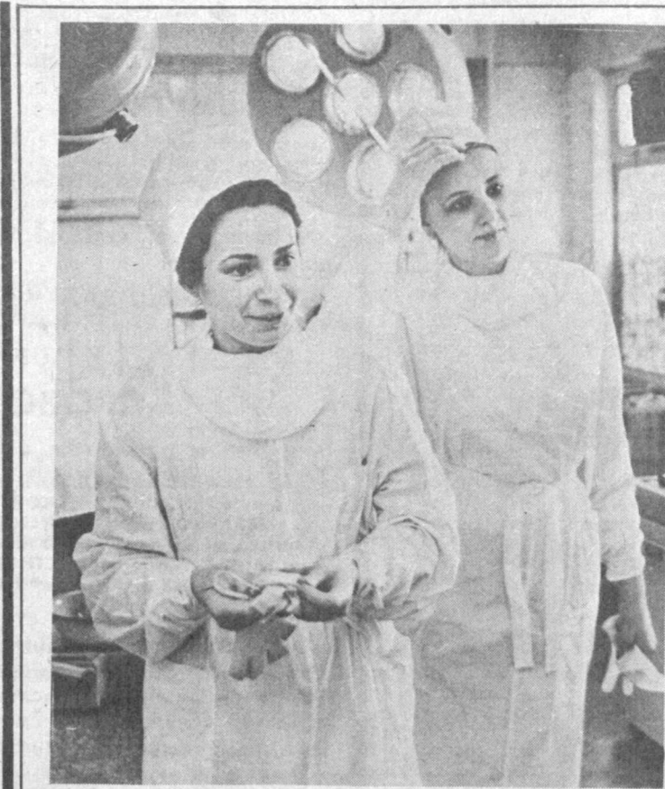
Маленькие дети болеют часто. И общая родительская проблема: найти хорошего врача.

Обрушившаяся на Приаралье бедствие не знает административных границ. Тем более, если они прохо-