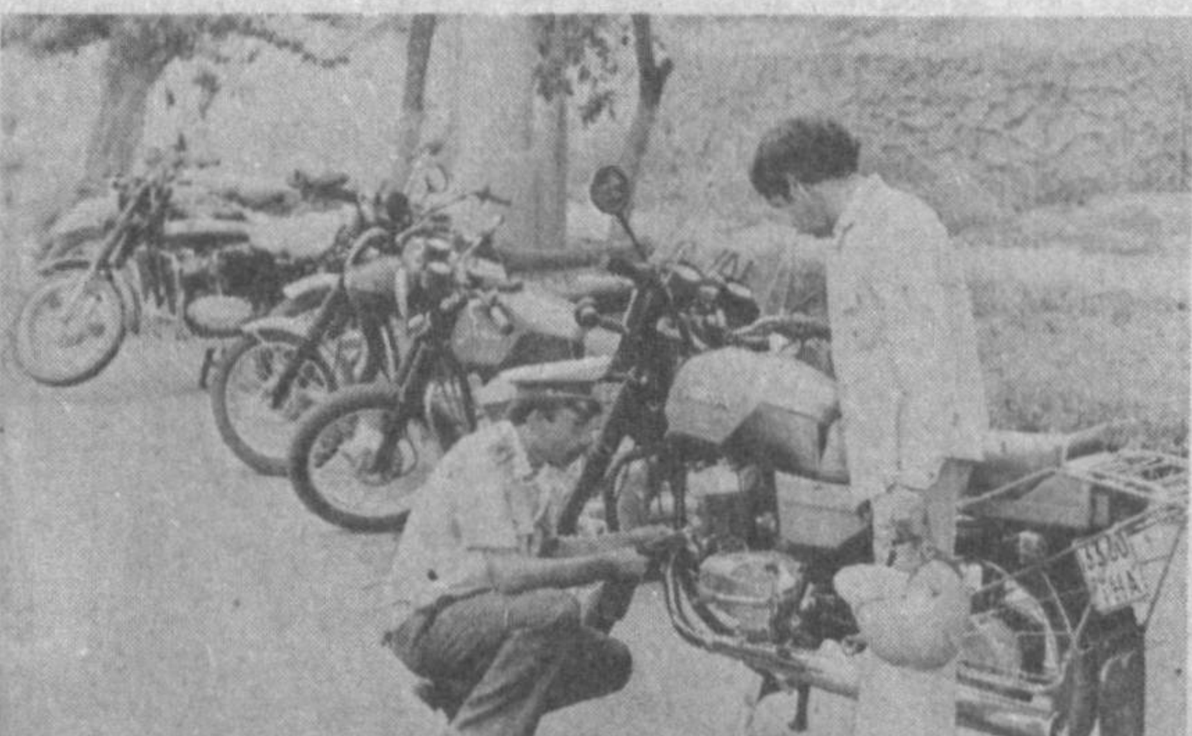
Нафаят автомобиллари, балки мотоцикллари ҳам ўз вақтида техник қўриқдан ўтказиш тоғи мўҳиндир.

Жонозовга бир ўй тинчлик бермасди. Қайси йўл билан бўлмасди хаёл суршининг ўзи ортинча нарсаси.