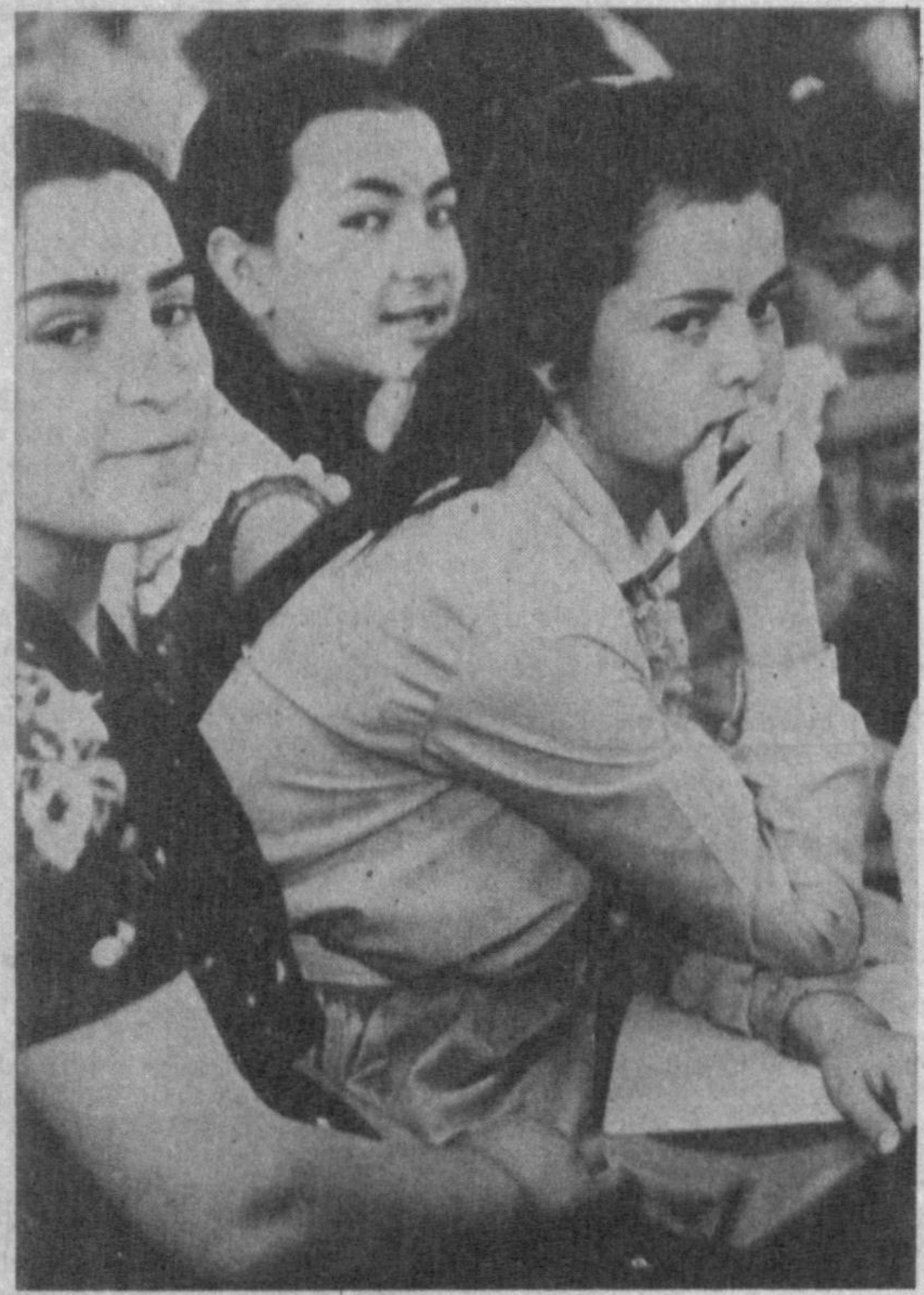
«УҚУВЧИЛИК — заъиди даврони». Бугун уқувчилик даврини ўтаётган бу ёш қизлар эртага катта ҳаёт бўсағисига қадам қўйилад. Келажакда олимпиа, ёзувчи, истеъдодли савьятор бўлиб етишишар. Ана шундай озулар бугун улар қалайда туғиб уради.

СОДИҚ акани бу атрофда кўпчилик таниди, ҳурмат қилади. У ўз умрини ёш авлод тарбиясига бағишлаган инсонлардан. Бир неча йилдири, пенсияда, қариллик гаштини сурати. Шундай бўлсада, тез-тез мактабга бориб туради, ўқувчилар билан учрашувлар ўтказиши, ўш ўқувчиларга маслаҳатлар беради. Озгина дарс ҳам олган.