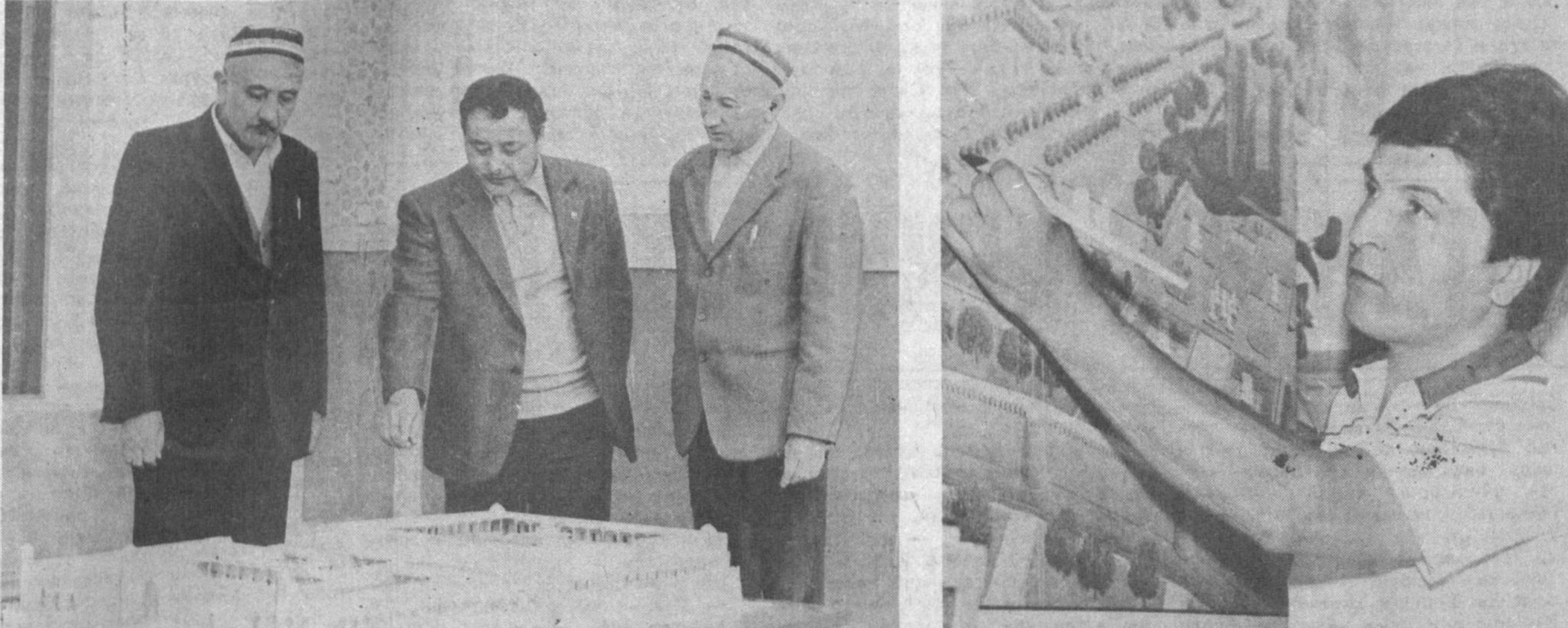
Урта Осиеда ягона ҳисобланган Ўзбекистон маданий ёдгорликларини таъмирлаш илмий-тадқиқот ва лойиҳалаш илмий-тадқиқот гуку меъморлари, республикамнинг турли ерларида жойлашган меъморий обидаларни ҳар томонлама чуқур ўрганишнинг, сўнг таъмирлаб, уларга иккинчи умр бағишлайдиган катта ҳажмдаги ишларни амалга оширишмоқдалар.