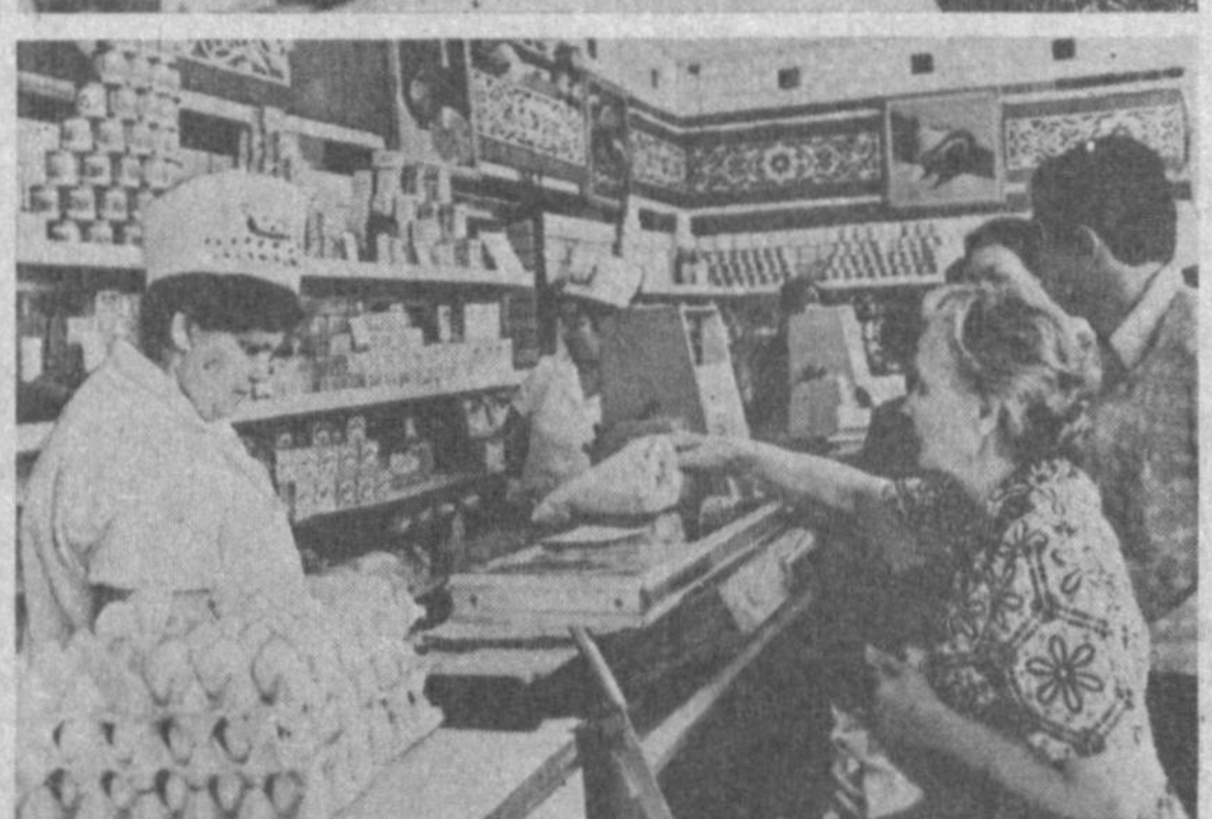
Фахрийларга хизмат кўрсатилган пайт.