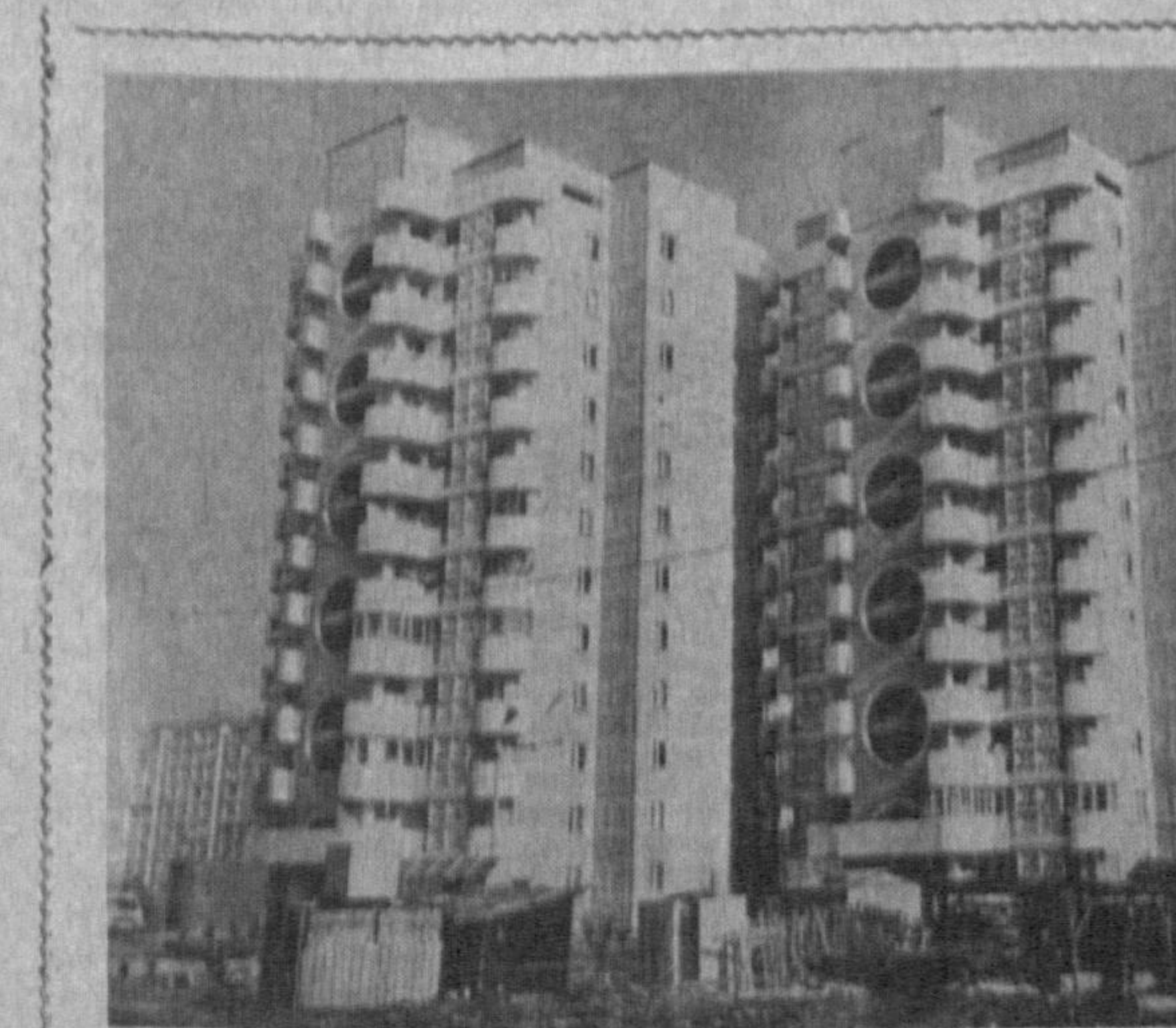
Ҳамза райони ҳудудида жойлашган «Галабин» 40 йиллик мавзеси йилдан-йилга оқиб ва гажум бўлиб бормоқда. Яқинда бунёдкорлар бу жойда қад кўтарган яна бир турар жой биносини фойдаланишга топширишди.

Комиссия Ўзбекистон ССР Савдо вазири, Дон маҳсулотлари вазири ва Ўзбекистон раҳбарларининг ахборотларини тинглади. Маъмур раҳбарлар жумҳуриятимизда яқин ойларида аҳолини белгилаган нормаларга кўра асосий озиқ-овқат маҳсулотлари билан таъминлаш масаласи ҳал этилганини матълум қилишди, айрим вилоятлар, шаҳарлар ва районларни маъмур масала юзасидан муттасил равишда текшириб туриш режалаштирилди.