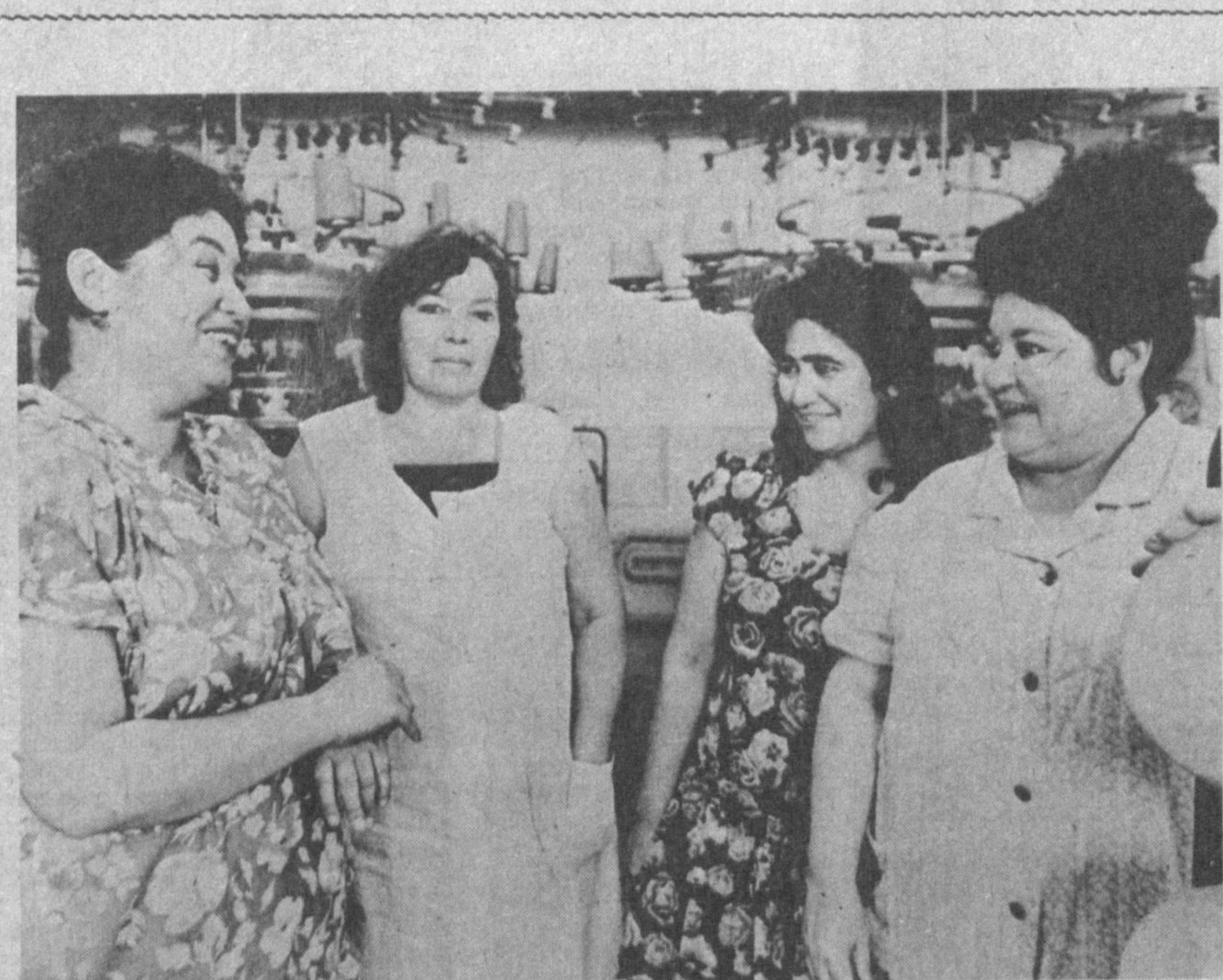
Тошкент устки трикотаж ишлаб чиқариш бирлашмасининг бу тўрт илҳор ишчиси турли мийлат вакиллари. Лекин уларнинг мақсадлари бир. У ҳам бўлса — халқимиз учун кўлаб сифатли маҳсулот ишлаб чиқариш.