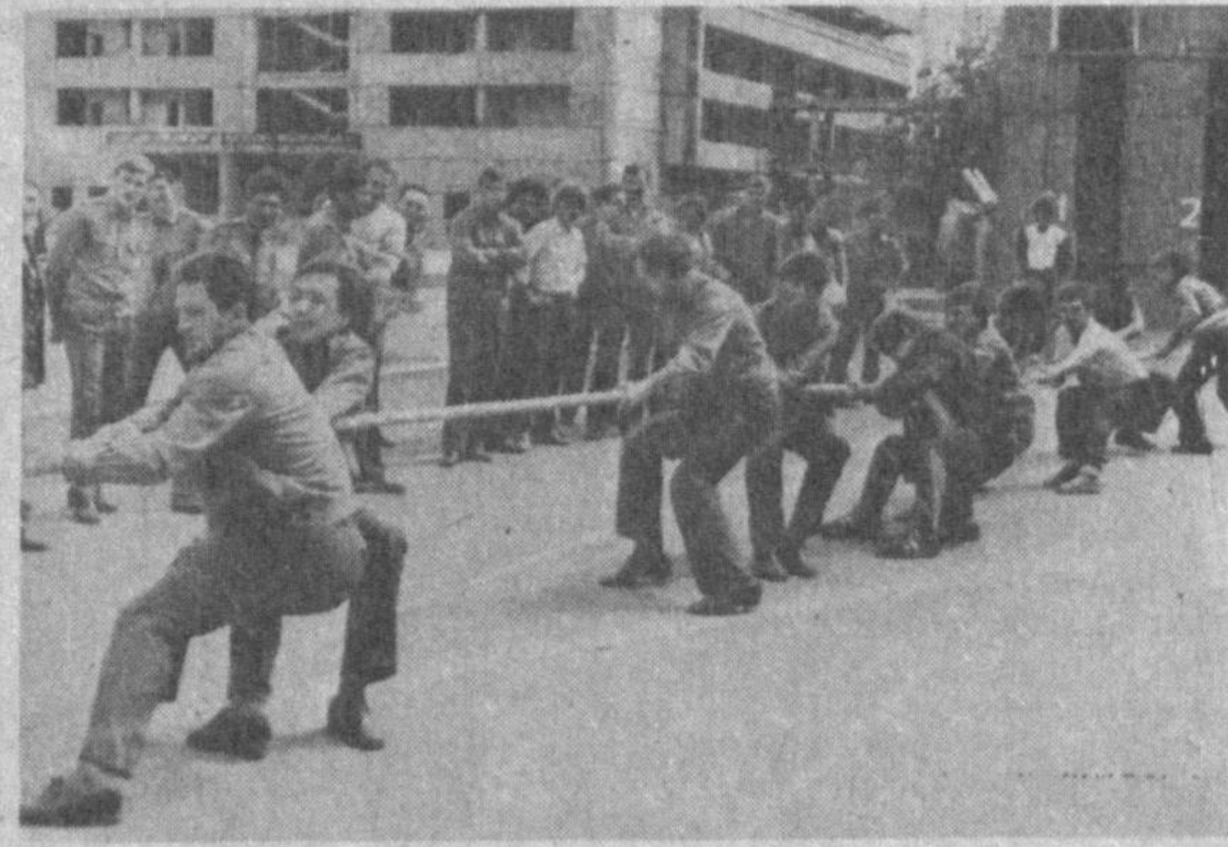
Шаҳримиз ўқув юртларида