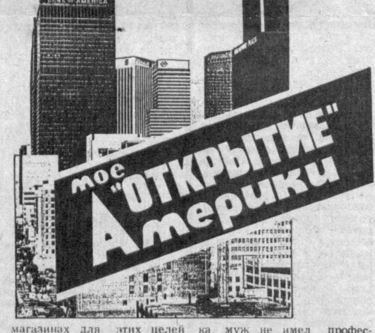
мое «Открытие Америки»