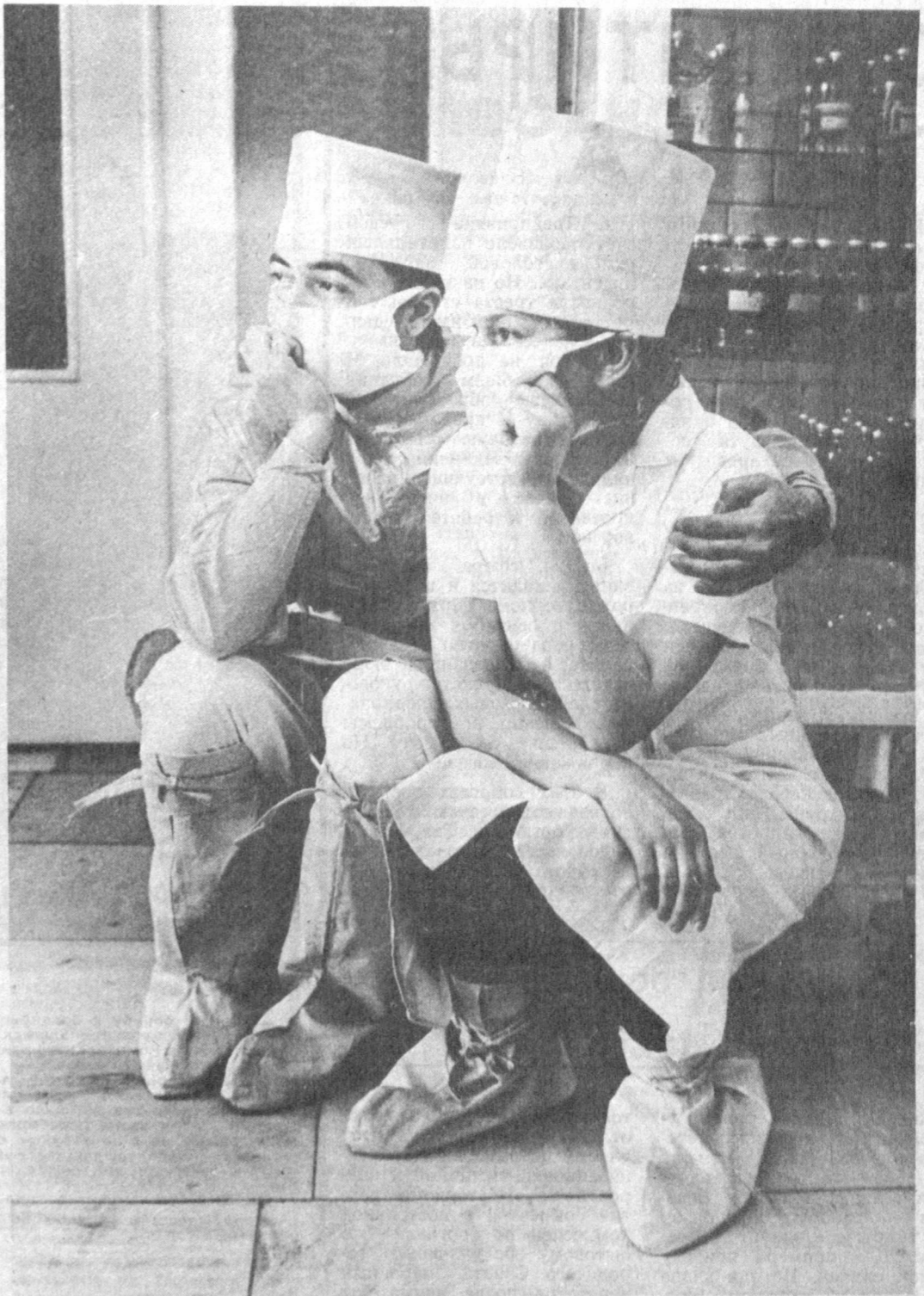
«Посидим, сестричка...» (Из серии «Хирурги»).

ФЕДЕРАЦИЯ ПРОФСОЮЗОВ УЗБЕКСКОЙ ССР ЦЕНТРАЛЬНЫЙ КОМИТЕТ ЛКСМ ОБЩЕСТВО КРАСНОГО ПОЛУМЕСЯЦА УЗБЕКИСТАНА РЕСПУБЛИКАНСКИЙ ФОНД МИЛОСЕРДИЯ