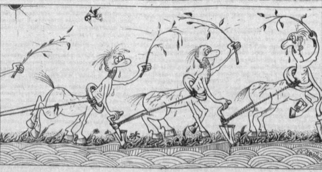
Рис. И. ЧЕЛМОДЕЕВА.