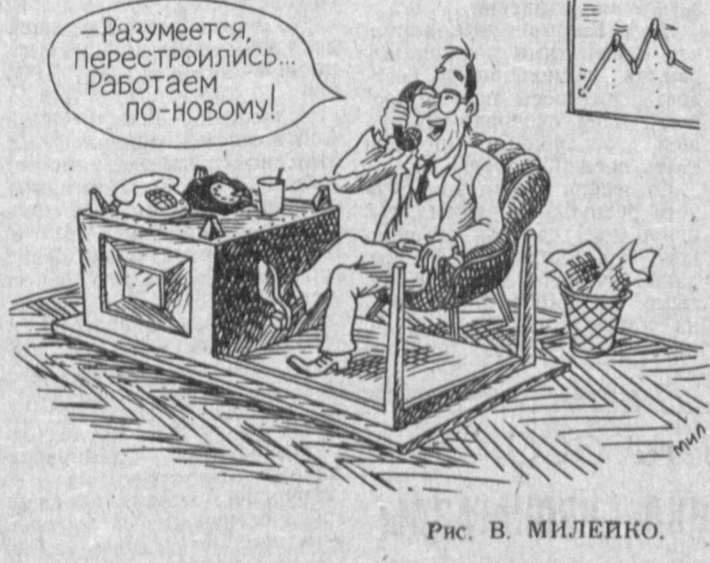
Рис. В. МИЛЕВКО.