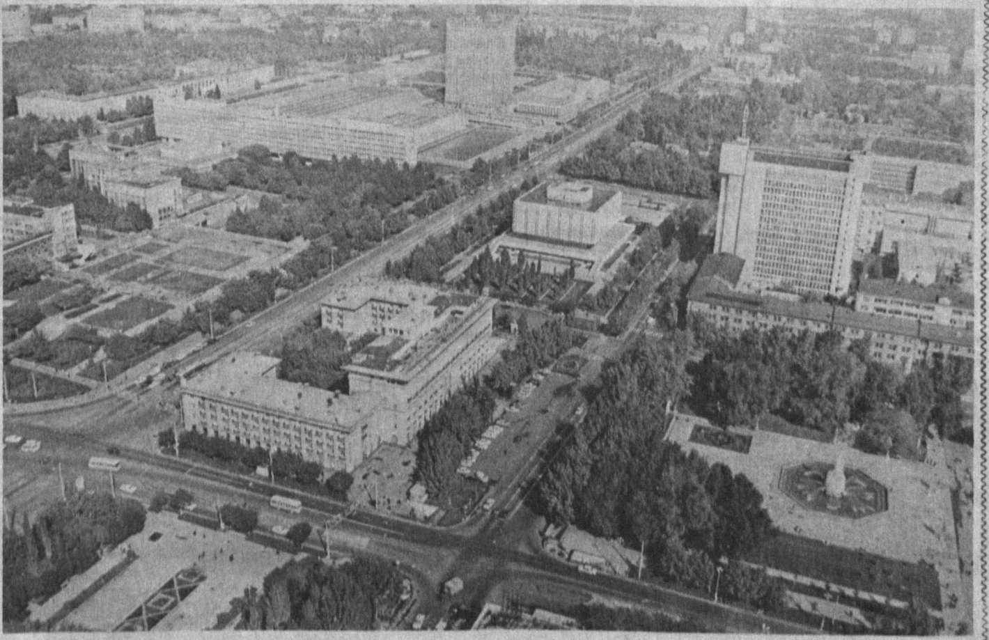
Азия Тошкентимизнинг сўлим боғлари, равои кўчалари ва маънавий ҳуснига хуси қўшиб турган осмонлар турар жой ва маданий-маънавий бинолар билан ўзган кишининг қалбига беҳишёр аниб бир сархуш фахр пайдо бўлади.

Анорбой ҲАЙДАРОВ, қуқуқшунос — Рўзномада чоп этиладиган ҳуқуқ асосларига доир мақолалар, воқеий ҳикоятлар жуда кўп муштарийларни қизиқтиради. Шехсен мени ҳам. Ҳуқуқ мавзусида берилган мақолалар аҳли, шунга қўшимча юнун моддалари ҳам мисоллар ёрдамида тушунтириб берилса саз бўларди. Менику майли, ҳуқуқшуносман, ҳуқуқнинг ўша нозик томонларига ҳам тушуна олам. Аммо оддий фуқаро эзилган нарсани фақат ўқибгина қолмай ундан бирон бир шарҳ — тушуна ҳам олса дейман. Бунинг учун, албатта тажрибали ҳуқуқшуносларни рўзномада чиқишларини ташкил қилиш керак бўлади, албатта. Фирқининг исботи учун ўзим ҳам келгуси сонларнинг бирини «Ишчи ҳуқуқи муҳофазаси» зусусида муштарийлар билан ўртоқлашиш истагимдан. Петр САВЧУК, тўғрилик ҳисобида иш юритувчи пардозовчилар бригадаси бошлиғи — «Тошкент оқшом» ва «Вечерний Ташкент» рўзномалари агар билсаларингиз шахримизнинг бугунги ва турури ҳисобланади. Шу жамоада меҳнат қилаётган барча ижодкорларга омад тилаймиз. Менинг бугун қувончим чексиз. Чунки кўришда меҳнат қилаётганимга ҳам 25 йил тўлди. Мен учун қўшақ байрам. Шу муддат ичнда бу рўзномаларда кўришимга онд жуда кўп мақолаларни ўқидим. Истардим, рўзнома саҳифаларида бундан кейин очерклар, шу куннинг муҳим муаммоларига онд материаллар бериб берилса, ҳар кенд шариотда ҳам сабр-бардошга эга бўлган инсонлар ҳақида кўпроқ ёзилса.