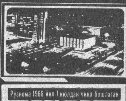
Рўнома 1966 йил 1 июлдан чиқа бошлаган