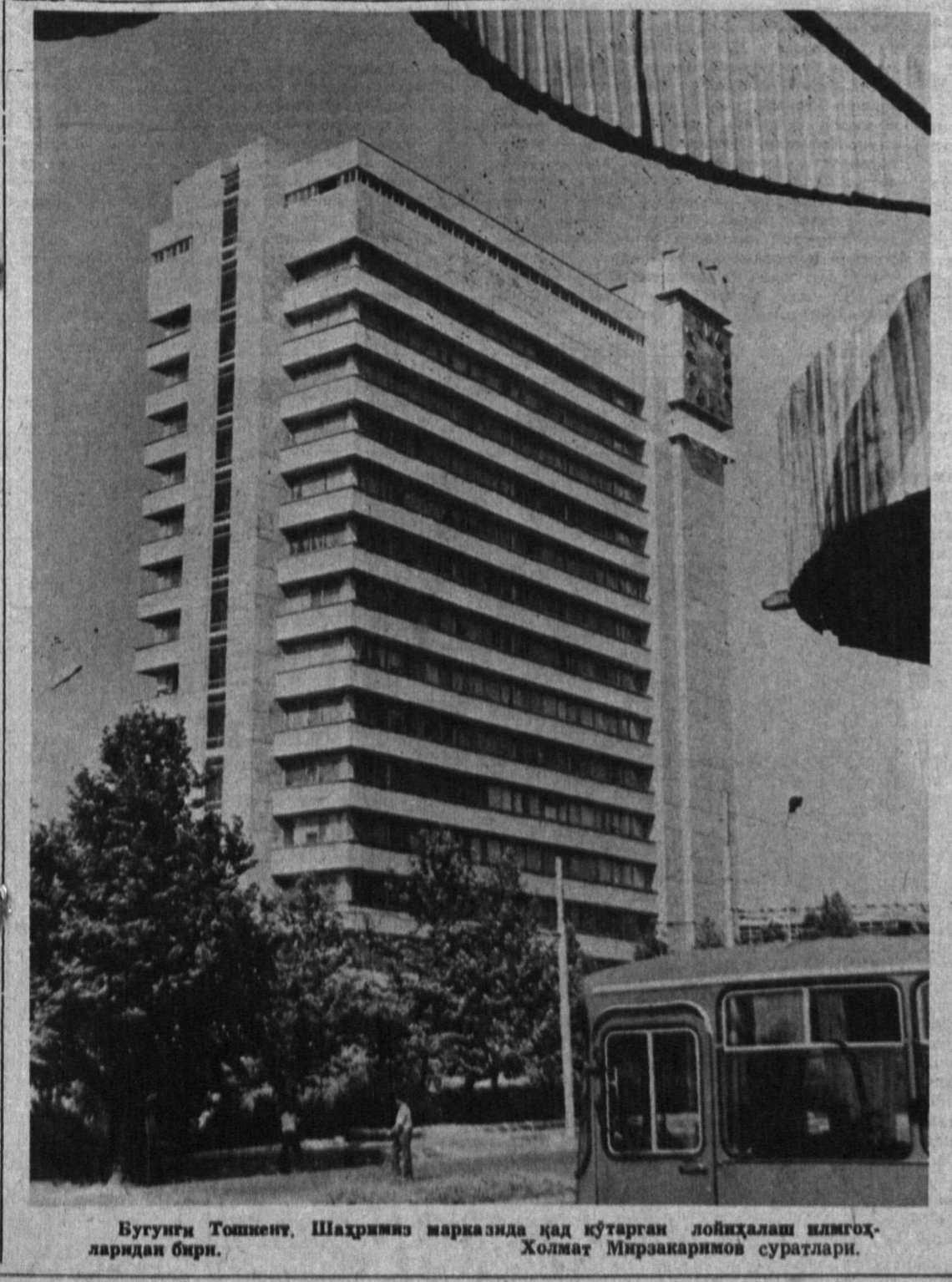
Бугунги Тошкент. Шаҳрийаз марказида қад кўтарган лойиҳалаш илмгоҳ-ларидан бири.