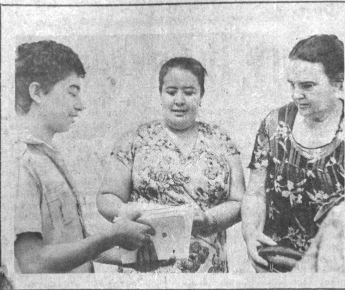
Вирнич сентябрь кўнрақлари жарангаб, янги ўқув йили бошлангичта саъодат куларини қолди. Мактаб ўқувчиларини қўйиб-кечак, дафтар-китоб, турли ўқув қуроллари билан тўқиниллаш шу кўнрақнинг энг муҳим вазифаси бўлиб турибди. Бор интисодиётни тақчиллигига қарамай, ўқувчи болаларини мактабга бекаму-қуст тайёрлаш керак. Шунинг назарда тутиб шахримиздаги 59-мактабда савдо растаси ташкил этилди.