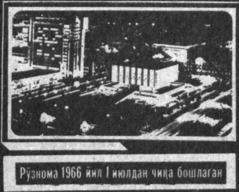
Рўзнома 1966 йил 1 июлдан чиқа бошлаган