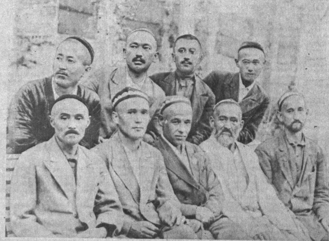
Унинг сиймосида одамийлик, фаузу камолнинг мужассам этган, бодабдиқда бетанор...