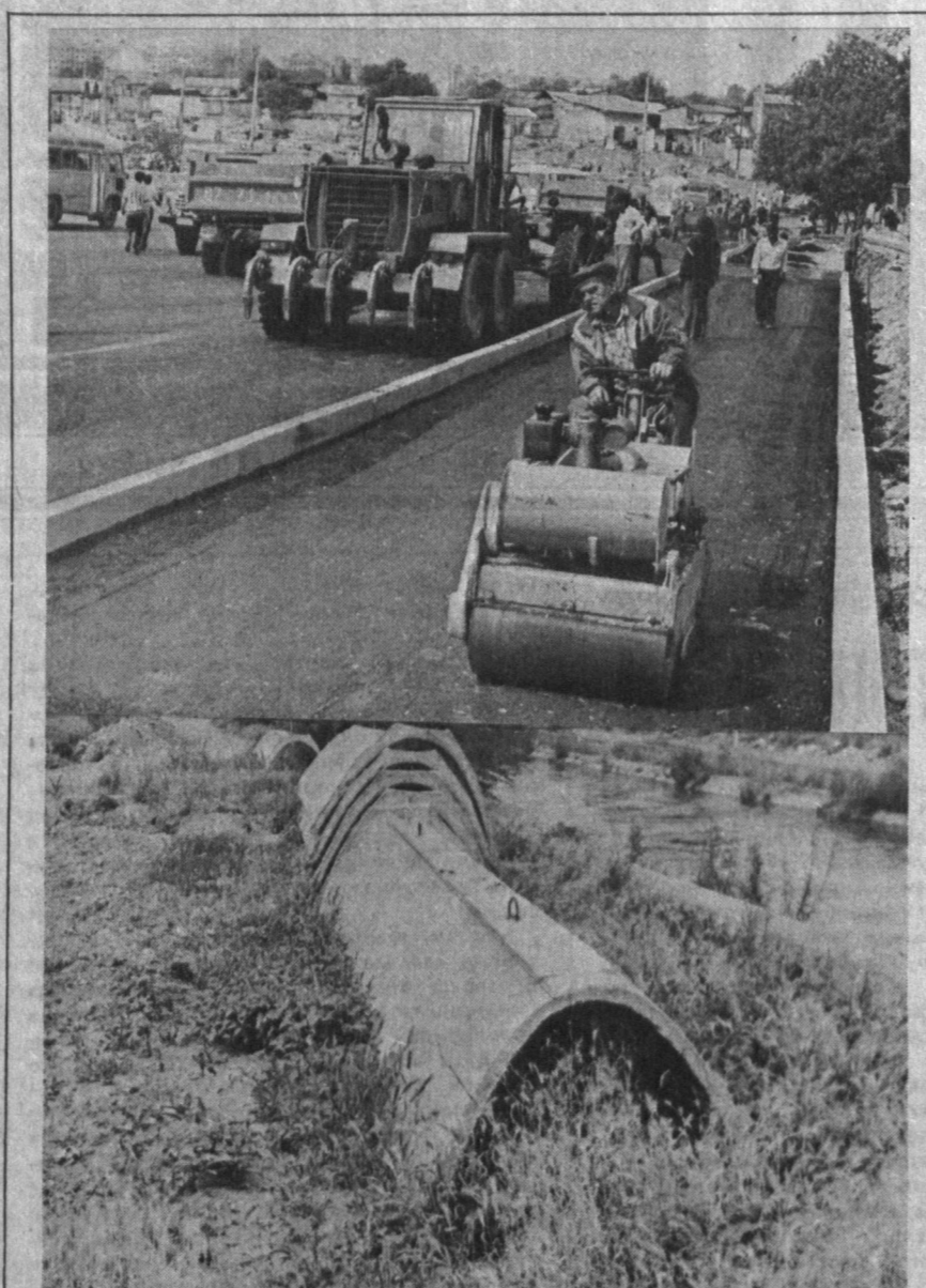
Йилнинг ҳамма фаслида, айниқса кузги-қишки мавсум пайтида йўл ва йўлакларнинг соз бўлиши ҳамшаҳарларимизга қўлайлик яратди. Ана шу босқичда энинг шу ганимат кунларида шахримиз кўчаларидаги йўللари тавмирдан чиқариш йўлсозларнинг муҳим вазифаларидан бири ҳисобланади.