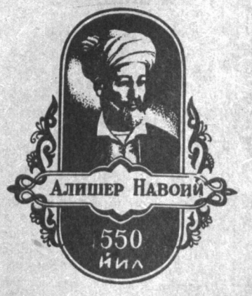
АЛИШЕР НАВОИЙ 550 йил