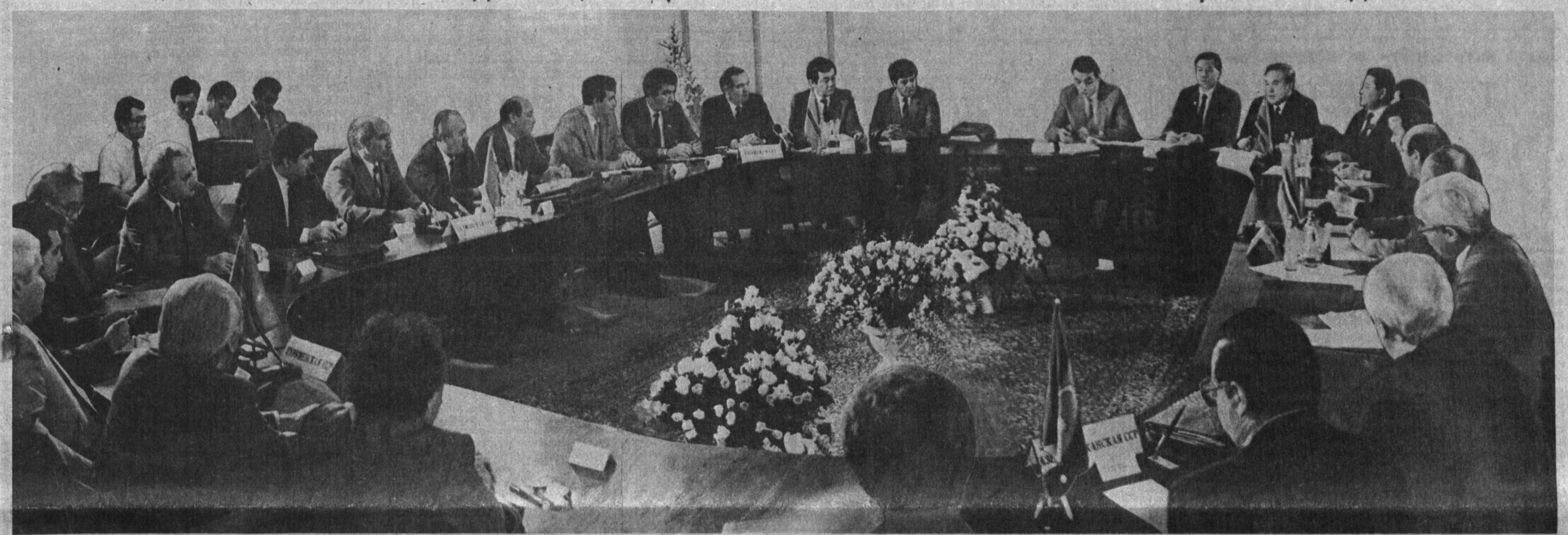
СУРАТДА: Кенгаш зямияда.

14 АВГУСТ КУНИ ЎРТА ОСИЁ РЕСПУБЛИКАЛАРИ ВА ҚОЗОҒИСТОН ПРЕЗИДЕНТЛАРИНИНГ УЧРАШУВИ ЎЗБЕКИСТОН ПОЙТАХТИДА МУҲИМ ҲУЖЖАТЛАРНИ ИМЗОЛАШ БИЛАН НИҲОЯСИГА ЕТДИ