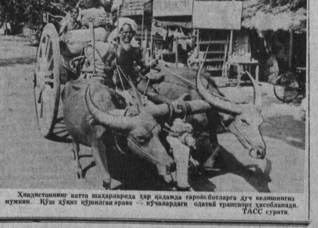
Хиндистоннинг катта шаҳарларида ҳар қандайд тарийф-ботларга дуч келишиниз мумкин. Қўш хўнж қўнган арава — кўчалардаги одатий транспорт ҳисобланади.

Фан оламида балки арзон пропан ишлатилмади. Олимларнинг фикрича, пропан совутич сифатида фреондан қолшмайди. Лекин янги қўлланилаётган модданинг битта хавфли томони — тез оловга айланишдир. Ихтирочилар бу музлаткича пропаннинг миқдорини жуда кам бўлар экан. Янги ихтиро мавжуд музлаткичлардан факат совутич аграгатининг ўзига хослиги билан фарқ қилади. ЭРТАЛАБ ЮГУРИШ... ХАВФЛИ ЯПОН мутахассислари эрталбаки югуришни инфаркт сари бир қадам эканлигини таъкидламоқдалар. Улар томонидан бир неча йил давомида югуришни инсон жисмига таъсири ўрганилган, эрталбаки ва кечкурунги югуришларининг қон текширувлари таққосланди. Хулоса ҳайратланарли: эрталбаки югуриш қон томларда қоннинг ивиб қоллишга мойиллигини оширади, чунки бу пайтда қон айланиши 6 фонизга ошади. Кечкурун эса, аксинча, қоннинг ивиб қоллиш хавфи 20 фонизга камаяди, бу эса томиларда айланаётган қоннинг тиклиб қилиниши камайтиради. Маъна РАҚИМОВ таёйирлаган.