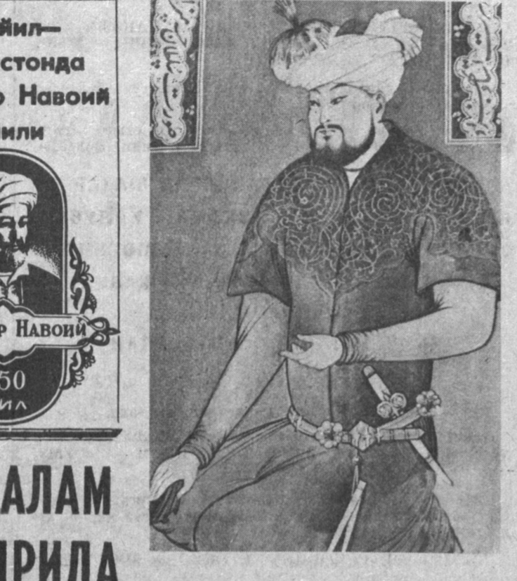
1991 йил — Ўзбекистонда Алишер Навоий йили