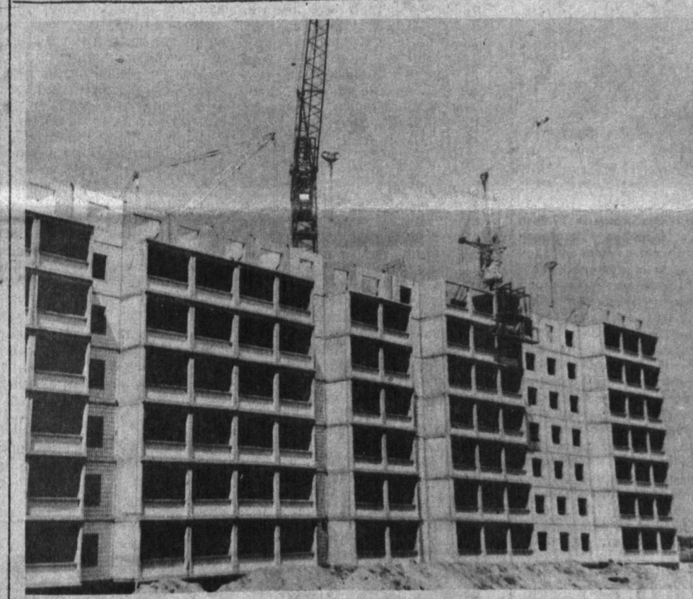
Кейинги йилларда шаҳрининг Сергели даҳаси кундан-кунга чирой очиб бормоқда. Шу қисқа вақт ичида бу ерда қанчадан-қанча турар жой бинолари қад кўтарди. Қанчадан-қанча хонадон эгалари уй тўғрисида ўтказилди. Маданий яншиш нуқталар ишта тушди.