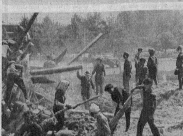
Вчера, 26 апреля, в 5 часов 23 минуты по местному времени в городе Ташкенте произошло землетрясение силой 7,5 балла.

По предварительным данным, в Ташкенте разрушено значительное количество жилых домов, главным образом старого типа. Разрушено также несколько больниц, школ, зданий государственных и общественных учреждений. Серьезно пострадали две фабрики.