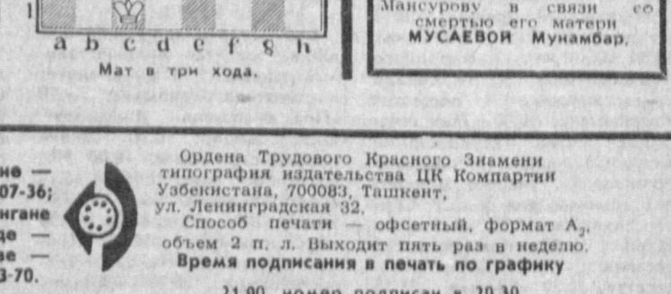
Мат в три кода.