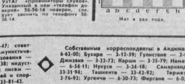
Мат в два кода.