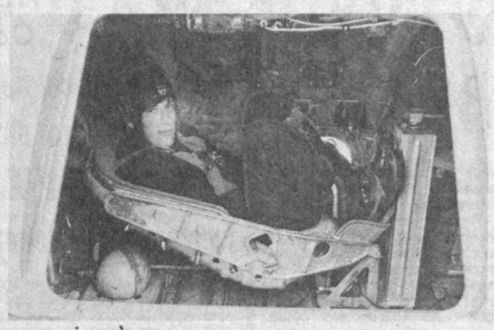
также в труднодоступную местность. Контейнер обеспечивает десантирование с самолета Ил-76 специалистом, не имеющим парашютной подготовки, как на сушу, так и на водную поверхность; в салоне контейнера.