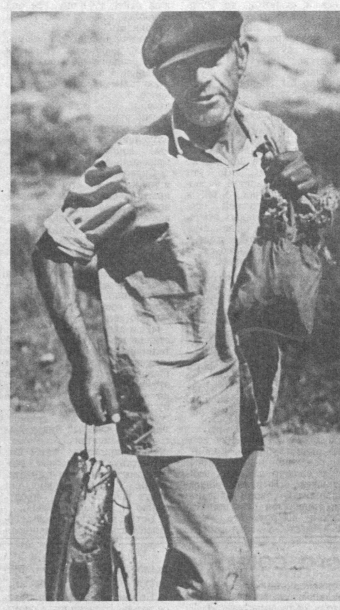
...Так и бичую — от реки до магазина.