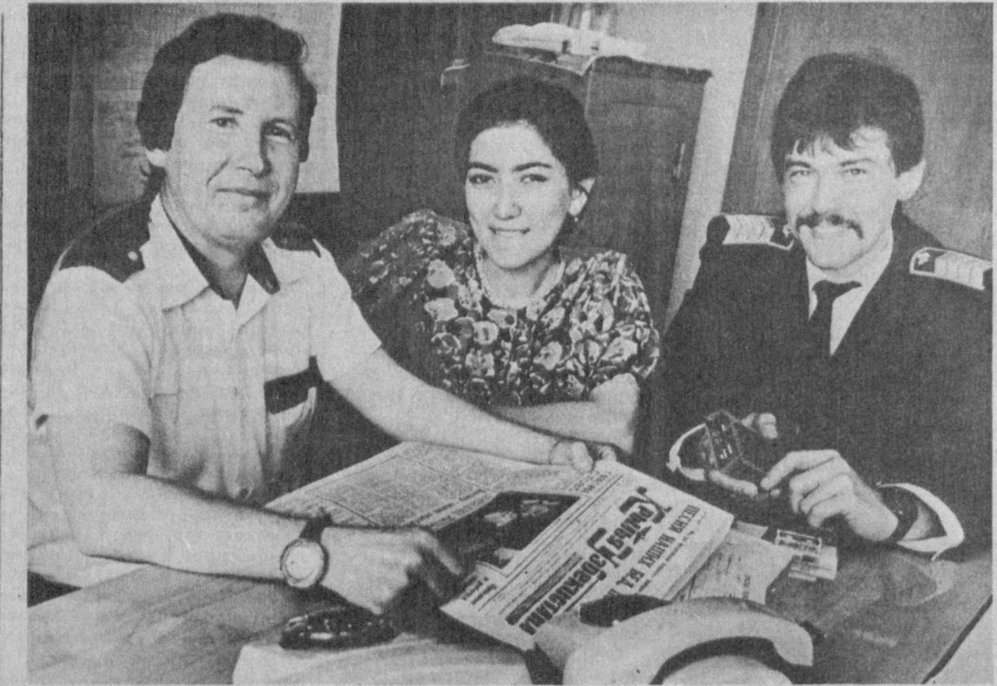
Сколько у республиканской авиации проблем! Додопинно знают, наверно, о них сотрудники да редактор многотиражной газеты «Крылья Узбекистана». За то и награжден почетным дипломом республиканского Союза журналистов по итогам прошлого года. Непросто освещать проблемы. Много их, и разные они. Тут уж мастерство журналистов да организаторские способности редак-