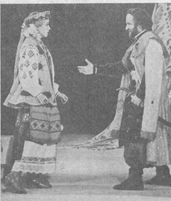
НА СНИМКАХ: сцены из спектаклей «Любовь — всегда загадка», «Бабий бунт» и «Помолвлена — не венчана».

студенты совершенно не умеют работать с ними. В специальных курсах они должны знакомиться с историей книги и книжной культуры в Узбекистане, с библиографией общественно-политической, художественной, детской, естественно-научной литературы республики.