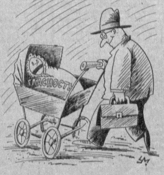
Рис. Александра УМЯРОВА.