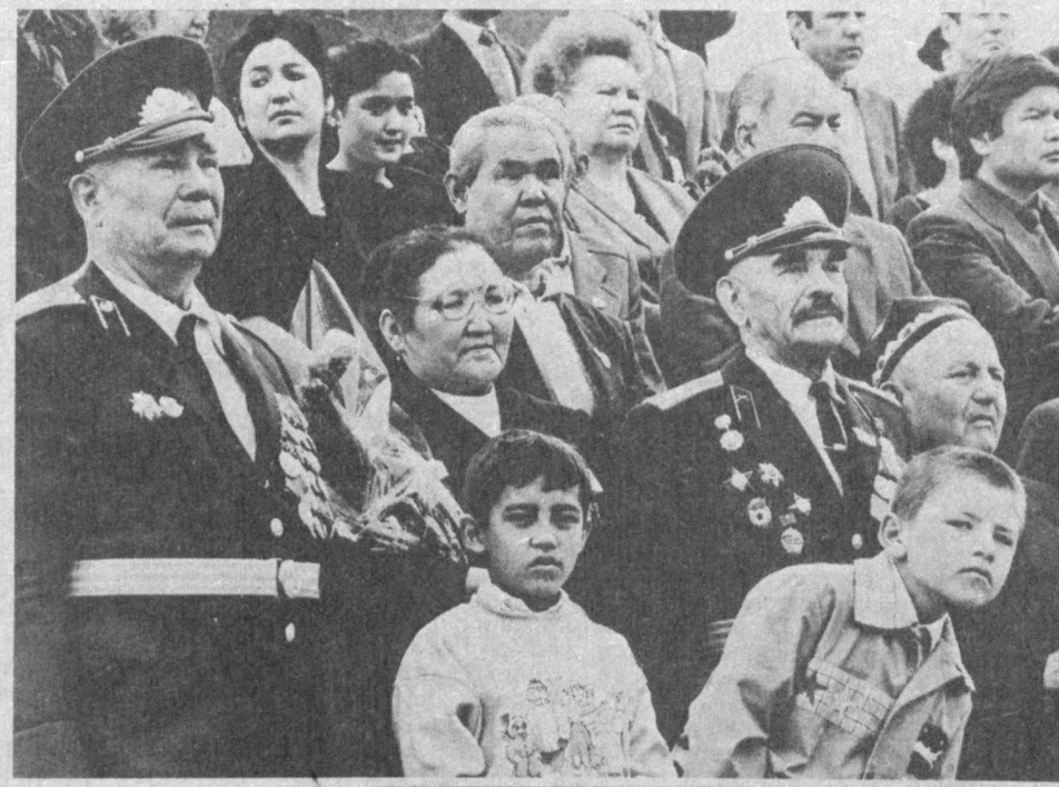
Репортаж с площади имени В. И. Ленина