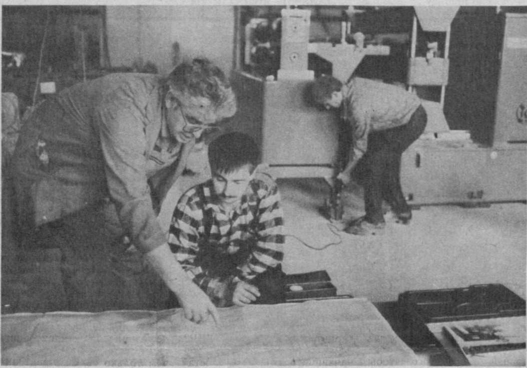
ТАШКЕНТ. Довести выпуск стеновых панелей с пенопоритовым наполнением, отвечающих мировым стандартам, до миллиона квадратных метров в год позволит автоматическая линия германской фирмы «Хель», которая устанавливается на Ташкентском экспериментальном заводе легких металлических конструкций. Для фирмачей это третья линия, устанавливаемая в СССР, — две уже действуют в Марнуполе и Липецке.

К. ЦИКАНОВ, Соб. корр. «Правды Востока», Хорезмская область.