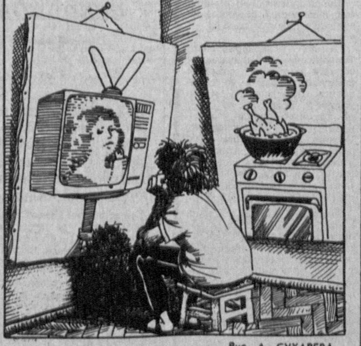
Рис. А. СУХАРЕВА.