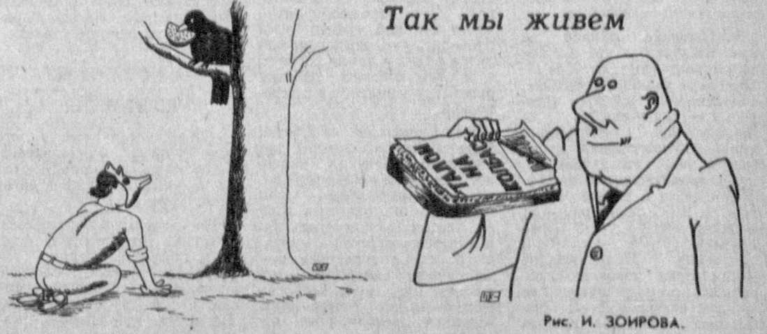
Рис. И. ЗОРИОВА.