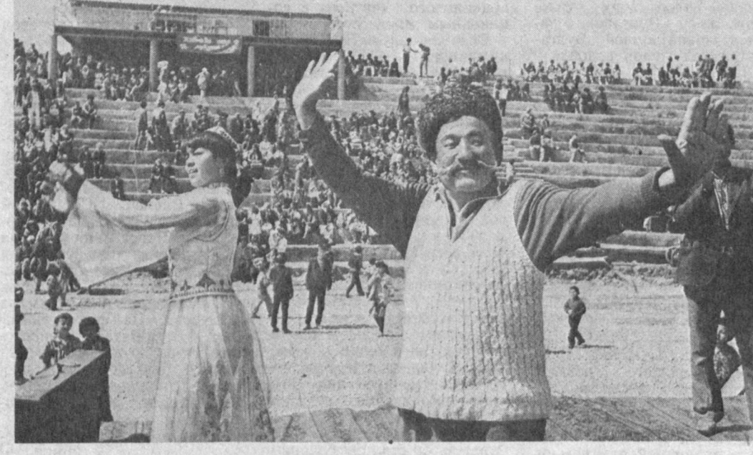
Корешний подарок получил труженники совхоза «Хазарбага» Денауского района Сырдарьинской области — здесь построено новый стадион, где, кроме спортивных состязаний, будут проводиться и народные гуляния.