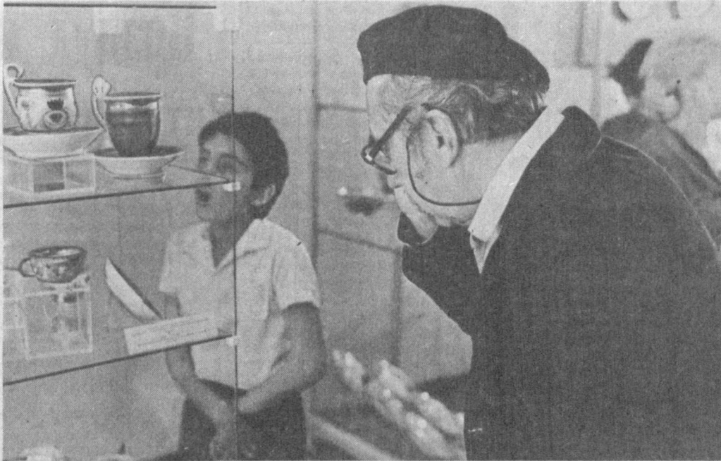
ТАШКЕНТ. В Государственном музее изобразительных искусств УзССР открылась выставка русского фарфора XVIII — начала XX веков. Представление подобной экспозиции, в которую вошли более 200 уникальных экспонатов из фондов музея, проводится впервые. Выставка посвящена 225-летию всемирно известного русского фарфорового завода купца Франца Гарднера, который был основан в селе Вербины, неподалеку от Москвы. В экспозиции представлена также продукция таких

масштабных преобразований в сфере экономики нужна прочная научная база. Но финансисты не знают, как свести концы с концами в государственном плане-бюджете на нынешний год. Следовательно, средства на субсидирование научных разработок следует привлекать непосредственно с низовых подразделений народного хозяйства. (УзТАГ).