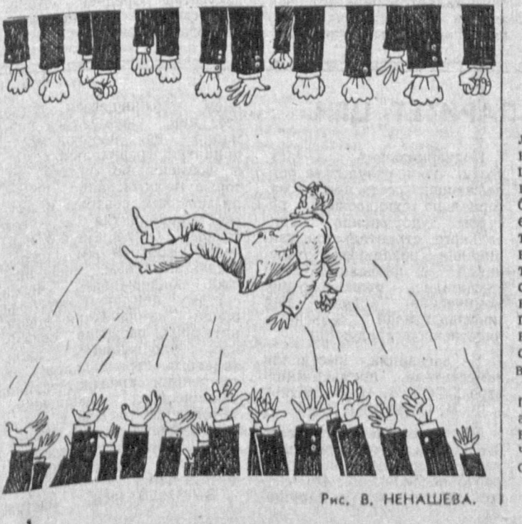
Рис. В. НЕНАШЕВА.

Пятипроцентный налог с продаж основных видов промышленных товаров и продовольственных товаров, введенный в конце декабря прошлого года Указом Президента СССР, отменен на всей территории РСФСР почти на все продовольственные товары. Об этом заявил на совместном заседании палат российского парламента Председатель Верховного Совета РСФСР В. Н. Ельцин. Он сказал, что Председатель Совмина республики И. С. Силаев подписал соответствующее постановление. На лодке сохраняется только на спиртные напитки, натуральный кофе, табачные и шоколадные изделия. (ТАСС).