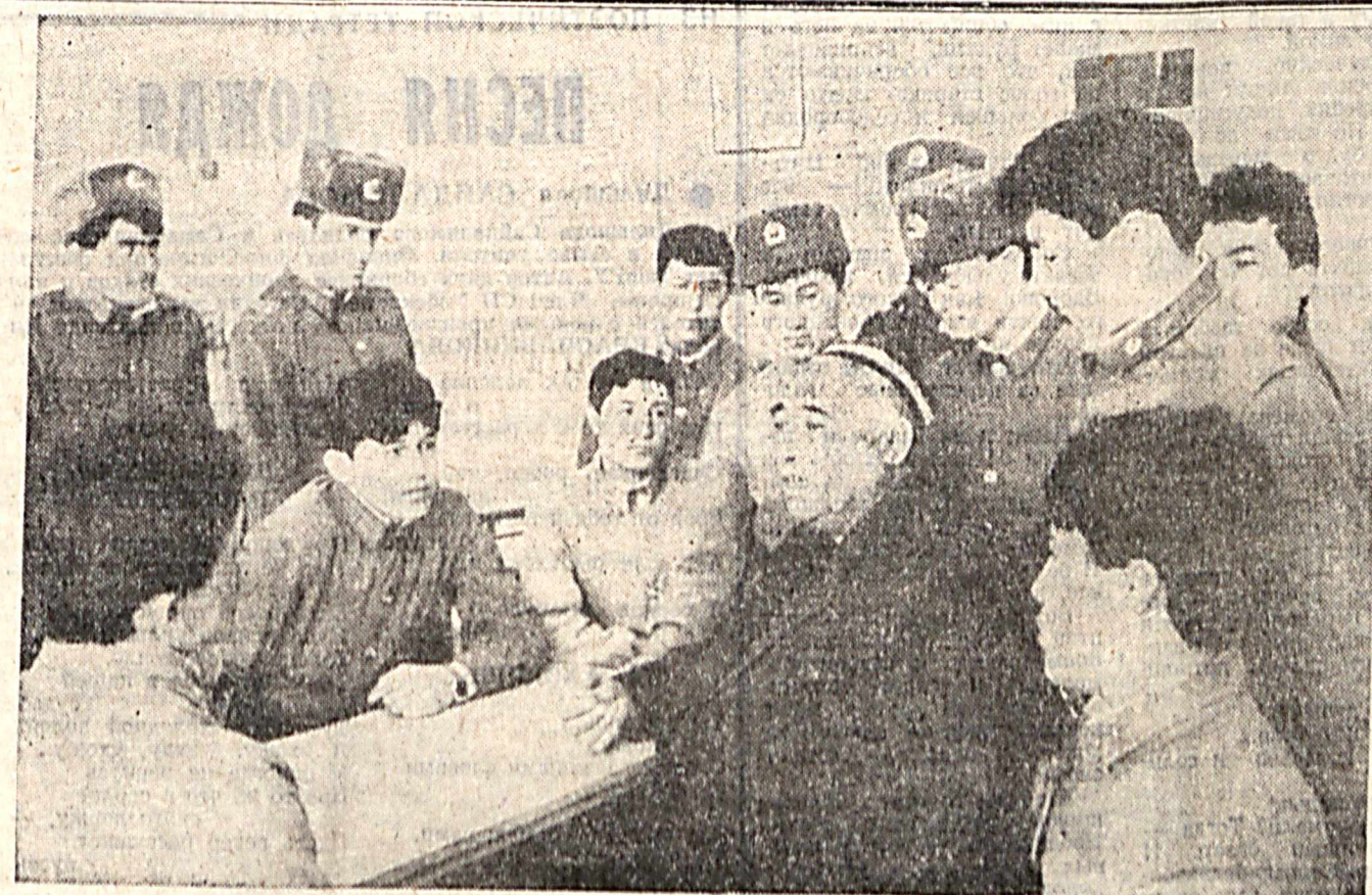
Пришел в казарму аскакал ГАЗЕТНОЙ СТРОКОЙ

Наш фонд будет и координировать деятельность махаллинских комитетов, —