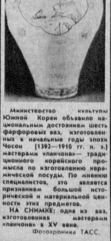
Министерство культуры Южной Кореи объявило национальным достоянием шесть фарфоровых ваз, изготовленных в начале годы эпохи Чосон [1392—1910 гг. н. э.] мастерами ипачона — традиционного корейского промысла по изготовлению керамической посуды. По мнению специалистов, это является признанием большой исторической и материальной ценности этих предметов. НА СНИМКЕ: одна из ваз, изготовленная мастерами «ипачона» в XV веке.

Между тем выходящих из здания парламента депутатов встречали свистом участники проходящего рядом массового митинга СДС. Было ясно, что большинство собравшихся поддерживает позицию более 40 депутатов ВНС, представляющих радикальное крыло Союза демократических сил. (ТАСС).