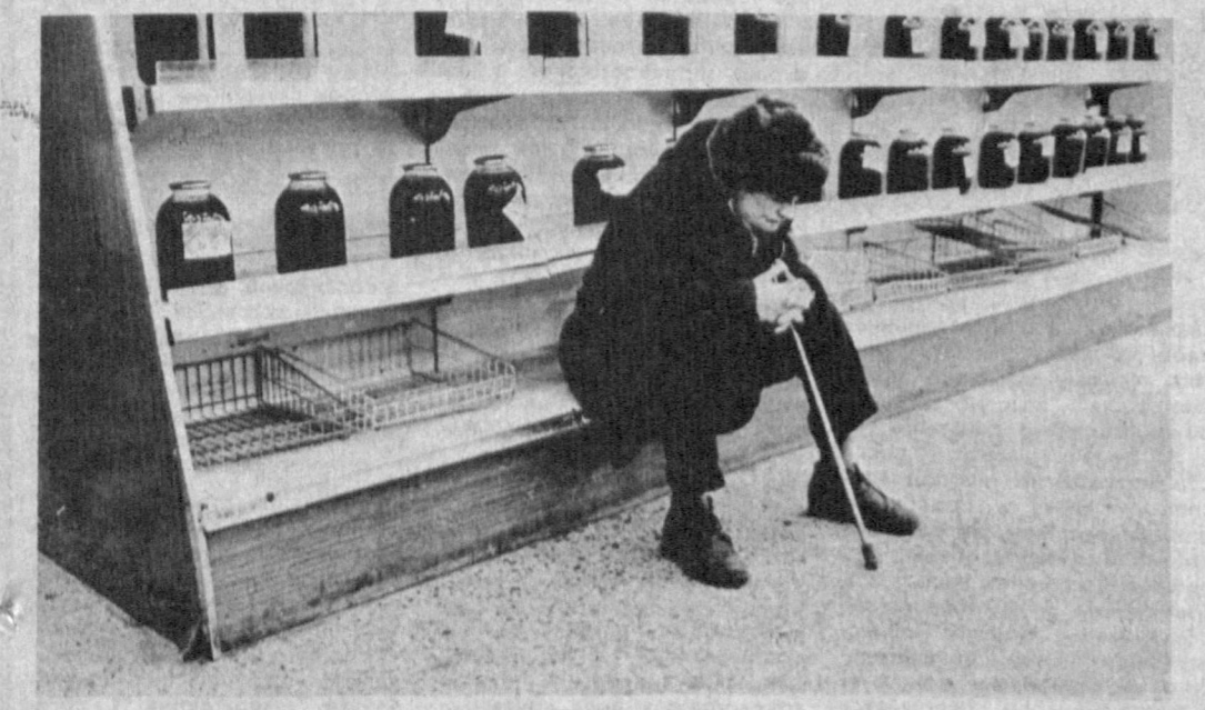
Сон-то есть, да как бы поест! (Нижний Новгород).