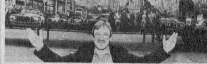
В то время, как ведущие политики ФРГ все еще продолжают споры о том, станет ли Берлин действующей столицей объединенной Германии (с разницей парламента и правительства), немецкий художник парламента и правительств, немецкий художник парламента и правительств, немецкий художник парламента и правительств...

Как сообщила сегодня газета «Йомиури», такой прогноз высказал в ходе состоявшегося здесь публичного выступления видный политический деятель, бывший председатель политического совета правящей в Японии либерально-демократической партии Митико Ватанабэ.