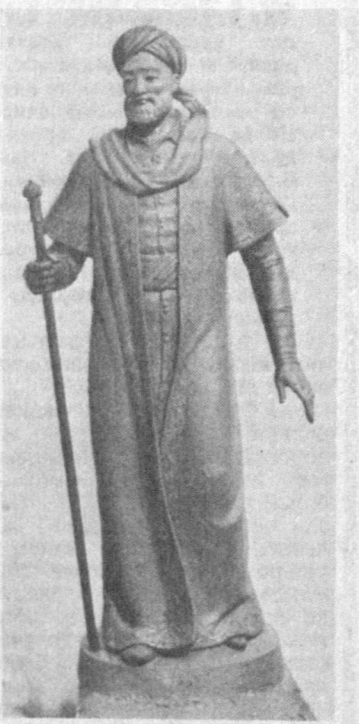
Соб. корр. «Правды Востока». Самарканд. НА СНИМКЕ: рабочая модель памятника А. Навои.