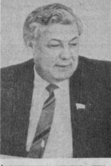
«минимального уровня жизни самых уязвимых слоев общества».

— Да, это очень важные законопроекты, но мы не можем ждать пассивно их принятия. Мы подсчитали: в Бухарской области за чертой бедности находятся около 140 тысяч человек — это более десяти процентов. Сотни тысяч едва сводят концы с концами. Поэтому мы поощряем любую инициативу местных властей, руководителей предприятий и хозяйств, направленную на облегчение их доли. Уже 169 предприятий, организации области изыскали средства для выплаты малоимущим компенсаций и пособий.