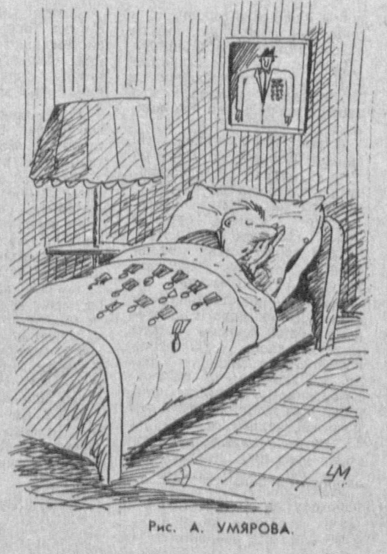
Рис. А. УМАРОВА.

Те же источники, отмечает газета, высказали предположение, что важной темой повестки дня совещания станет вопрос о предоставлении экономической помощи Советскому Союзу. Позиция Японии по этой проблеме, как сообщило в понедельник информационное агентство Киодо Цуси со ссылкой на правительственные источники, на сегодняшний день в целом определилась. Токио не намерен соглашаться на оказание крупномасштабной финансово-экономической помощи Москве.