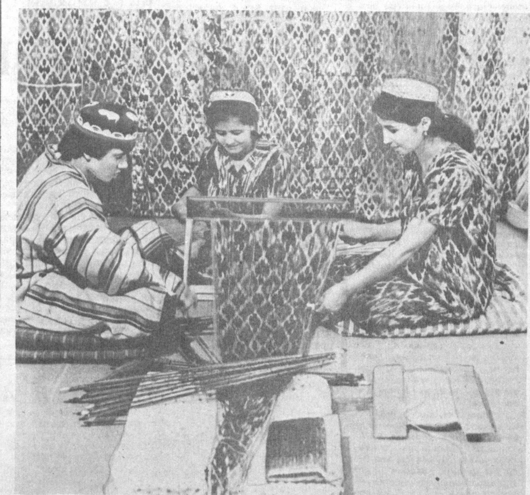
НАШКАДАРЬИНСКАЯ ОБЛАСТЬ. Около десяти филиалов Ямбаского районного промкомбината открыты в сельской местности. Один из них — шелкоткацкий цех по выпуску атласа. За одну смену каждая ткачиха производит до 11—12 погонных метров ткани. В цехе пока установлены восемь станков, в ближайшее время их количество увеличится до 20. Это даст возможность до конца года изготовить продукции на 100 тысяч рублей.

Хочу особенно подчеркнуть, что «Ташкентская деловая встреча» не будет ограничиваться лишь пятью