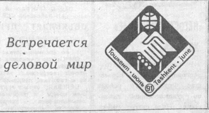
Встречается деловой мир

Хочу особенно подчеркнуть, что «Ташкентская деловая встреча» не будет ограничиваться лишь пятью