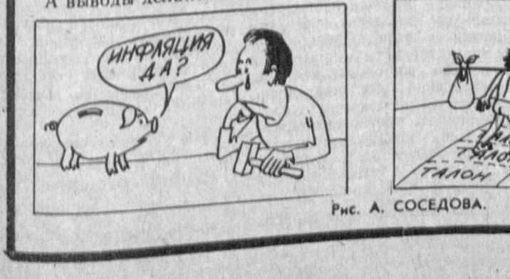
Рис. А. СОСЕДОВА.