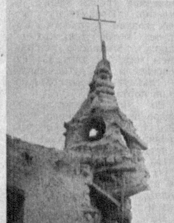
Коптский монастырь св. Павла в египетской Восточной пустыне, в 250 км от Каира, — один из старейших на нашей планете. Он был основан в IV веке на том месте, где по преданию, в течение 80 лет жил в пещере волею восточного первого отшельника христианства — св. Павел. В пещере же, превращенной в часовню, он и похоронен.

Судьба была немилостива и монастырь в конце XV века он был разорен и сильно разрушен ноичинами-бегунами. Примерно в течение 100 лет там не было затронут ни одного камня. Вудун впоследствии восстановлен, он в конце XVI века подвергся новому разорению со стороны бедуинов.