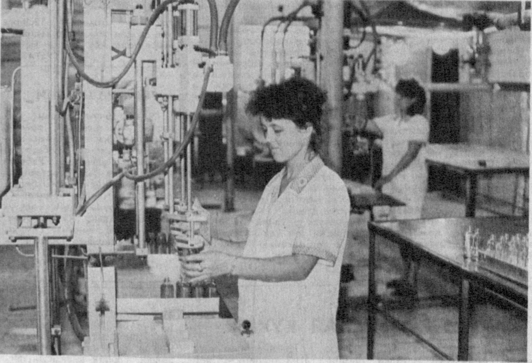
ТАШКЕНТСКАЯ ОБЛАСТЬ. Первая опытная партия лоссона для лица с натуральной женьшеня получена на Янгйульском биохимическом заводе. С завершением монтажа оборудования для получения новой продукции здесь намереваются выпускать один миллион флаконов лоссона в год. НА СНИМКЕ: в цехе розлива биолоссона «Женьшень».